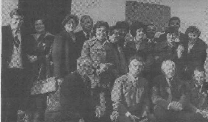
Pred spominsko hišo v Trebčah