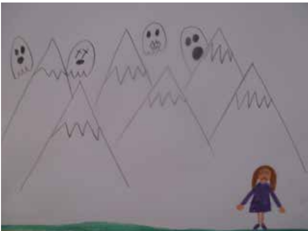
Slika 6: Likovno izražanje na temo pravljice.

Pri vrednotenju svojega izdelka (slika 6) je učenka pojasnila, da ne razume, zakaj se je deklica Maja bala tudi psičkov, ko so pa ti prijazni (deklice je imela doma psička). Ob ilustraciji je učenka komentirala, da je Maji čarobni šal pomagal, da je premagala strah pred kužki in jih je zmogla celo pobožati.