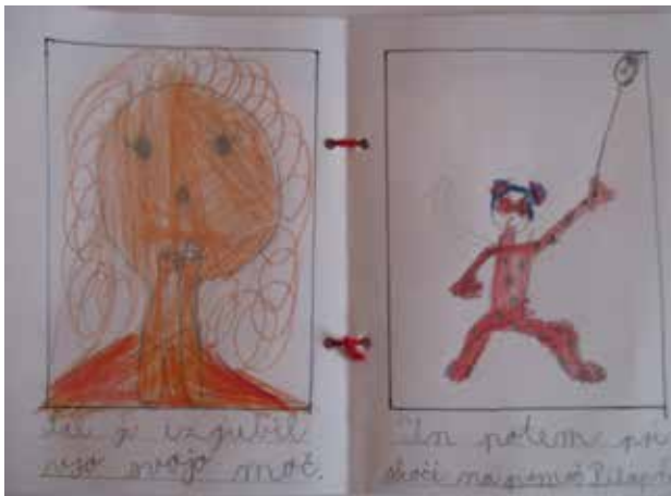
Sliki 1 in 2: Žepna pravljica Čarobni šal izgubi moč.

Da so otroci pravljico lahko podoživljali, dokler jim je bilo zanimivo, smo ilustracije plastificirali in jih pritrdili na steno v zaporedju kot je narekovala vsebina. Ilustracije so ostajale aktualne dlje časa. Mnogi so pravljico podoživljali tudi preko spontanega likovnega izražanja. Iz