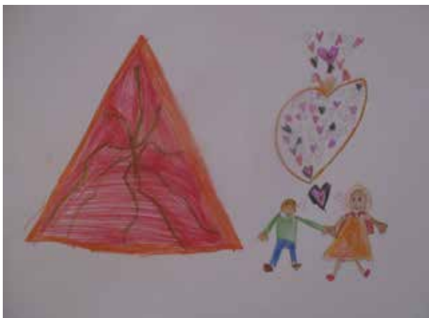
Sliki 3 in 4: Maja spozna prijatelja Valentina.