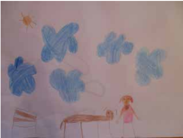
Slika 5: Maja s šalom premaga strah pred psički.

Ilustraciji med drugim izražata empatijo ter veselje ob tem, da je Maja našla dobrega prijatelja. Tudi sicer je vrednotenje ob ilustracijah učencev pokazalo, da so navdušeni nad učinkom šala. Iz povratnih informacij sem zaznal, da ni bilo vsem takoj jasno, da deklica Maja na pohodu v gore z Valentinom ni več potrebovala šala. S pomočjo mojih odprtih vprašanj in pomoči vrstnikov so ti kmalu spoznali čemu.