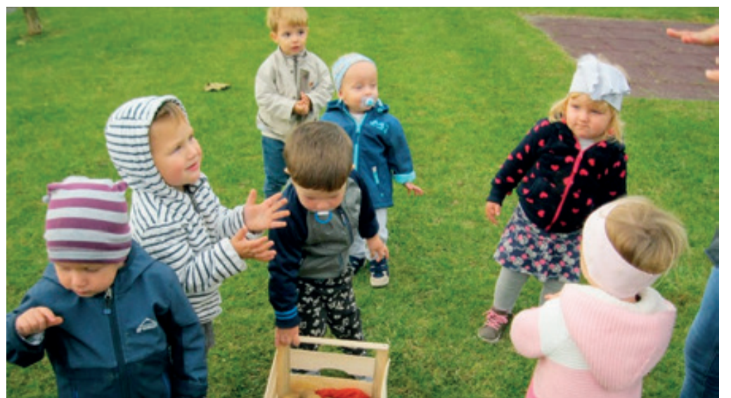
Pobiranje krompirja pri najmlajših