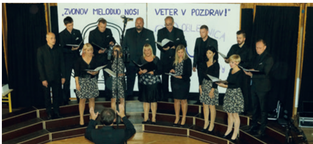
Komorni zbor Glasis prepeva že 5. sezono.