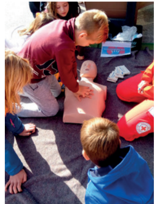
Šolarji se seznanjajo z osnovami oživljanja

Ponujamo široko paleto medicinskih pripomočkov na naročilnico.