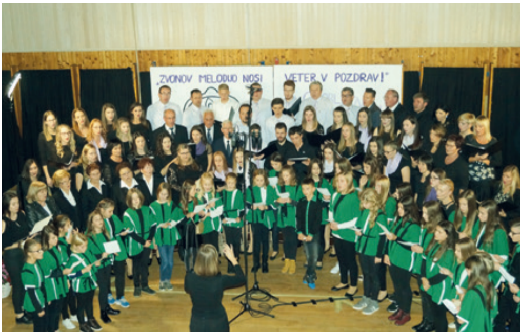
»Naj rod naš še dolgo živi!« je donelo po dvorani.