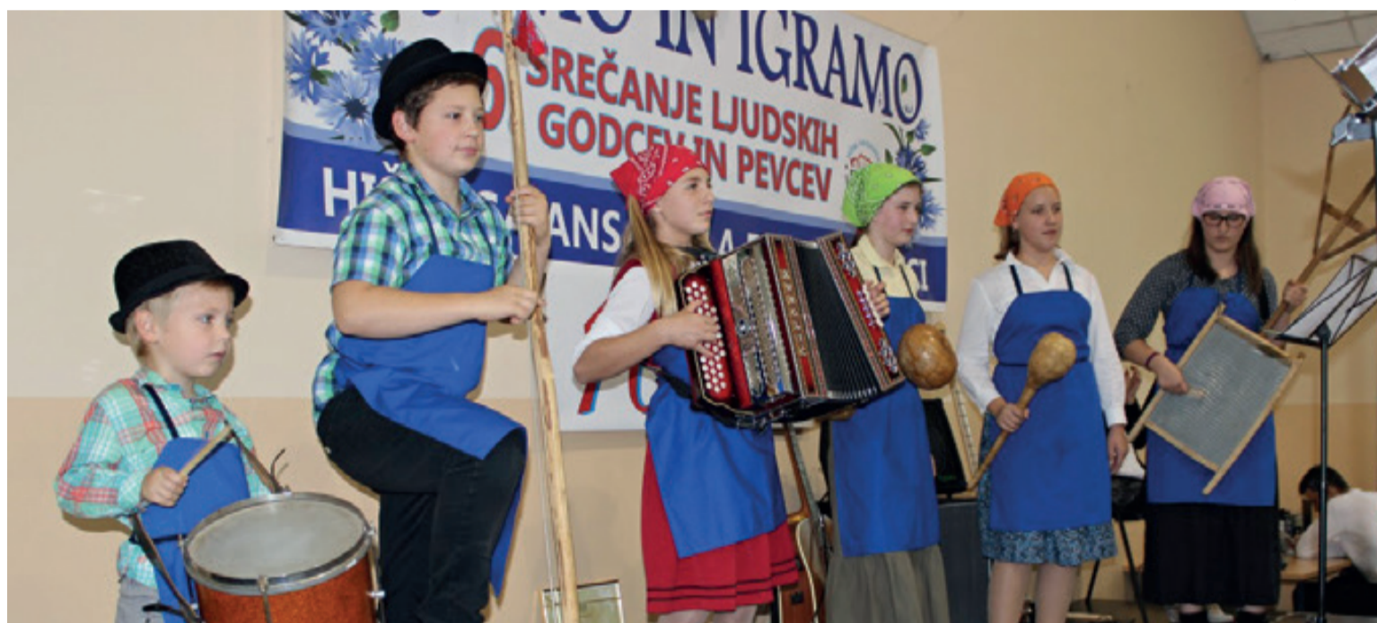
Tudi podmladek prihaja...