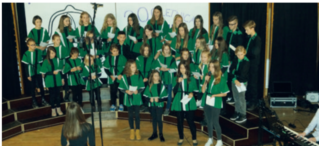
Mladi so jamstvo za bodočnost društva.