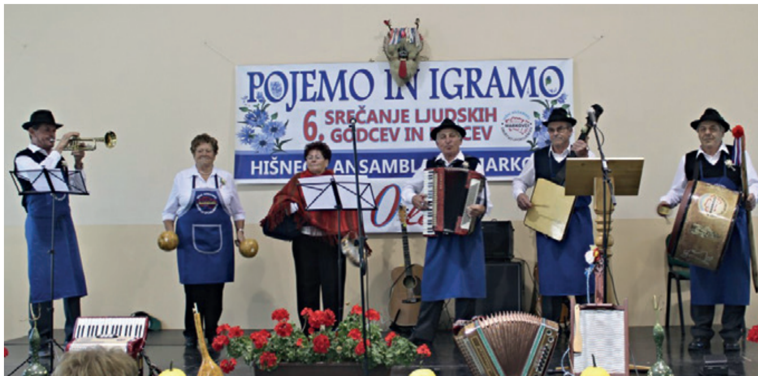
Hišni ansambel DU Markovci