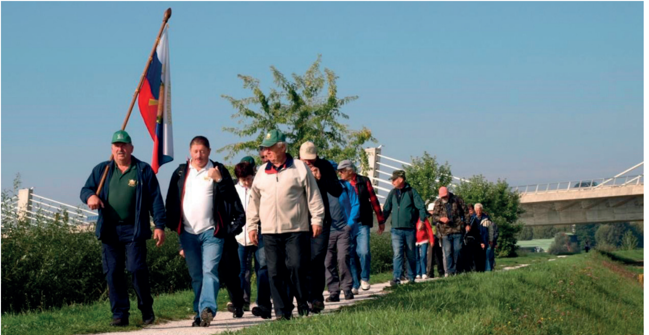
Pohodniki, člani Območnega združenja veteranov vojne za Slovenijo Ptuj