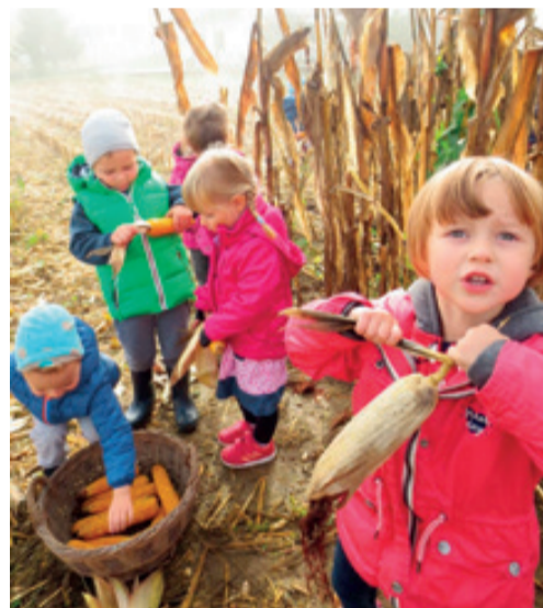
Trganje in kožuhanje koruze