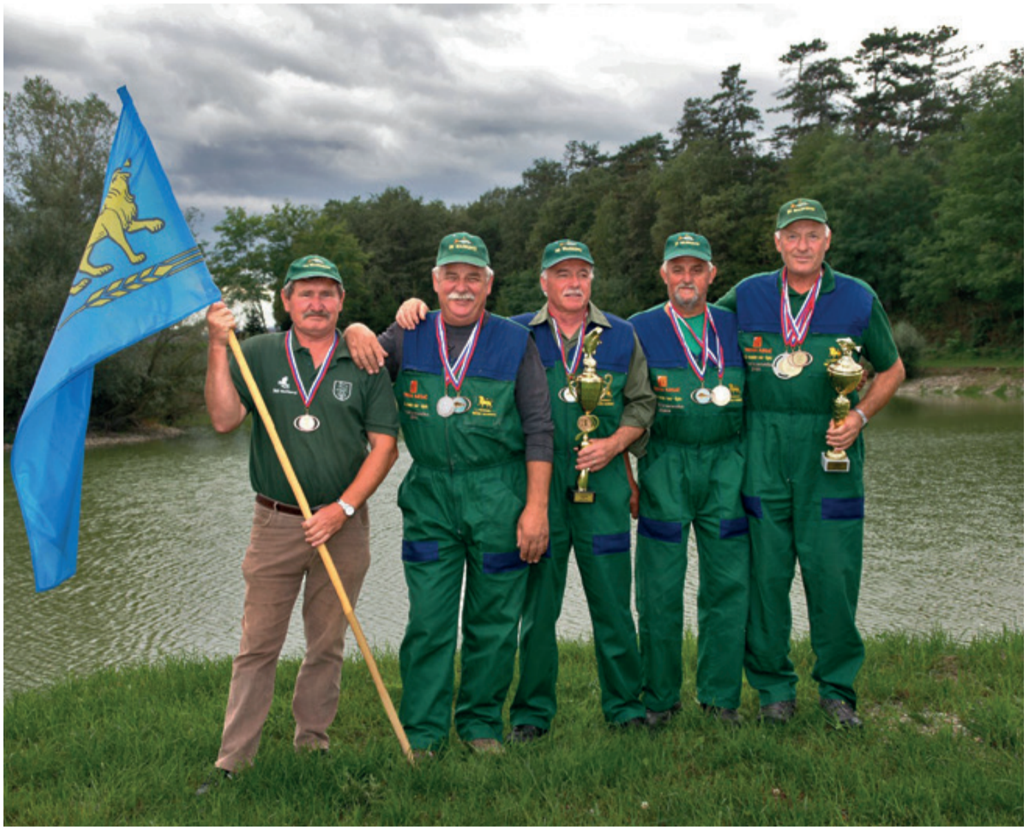
Markovski upokojenci so že drugič postali državni prvaki v lovu rib s plovcem.