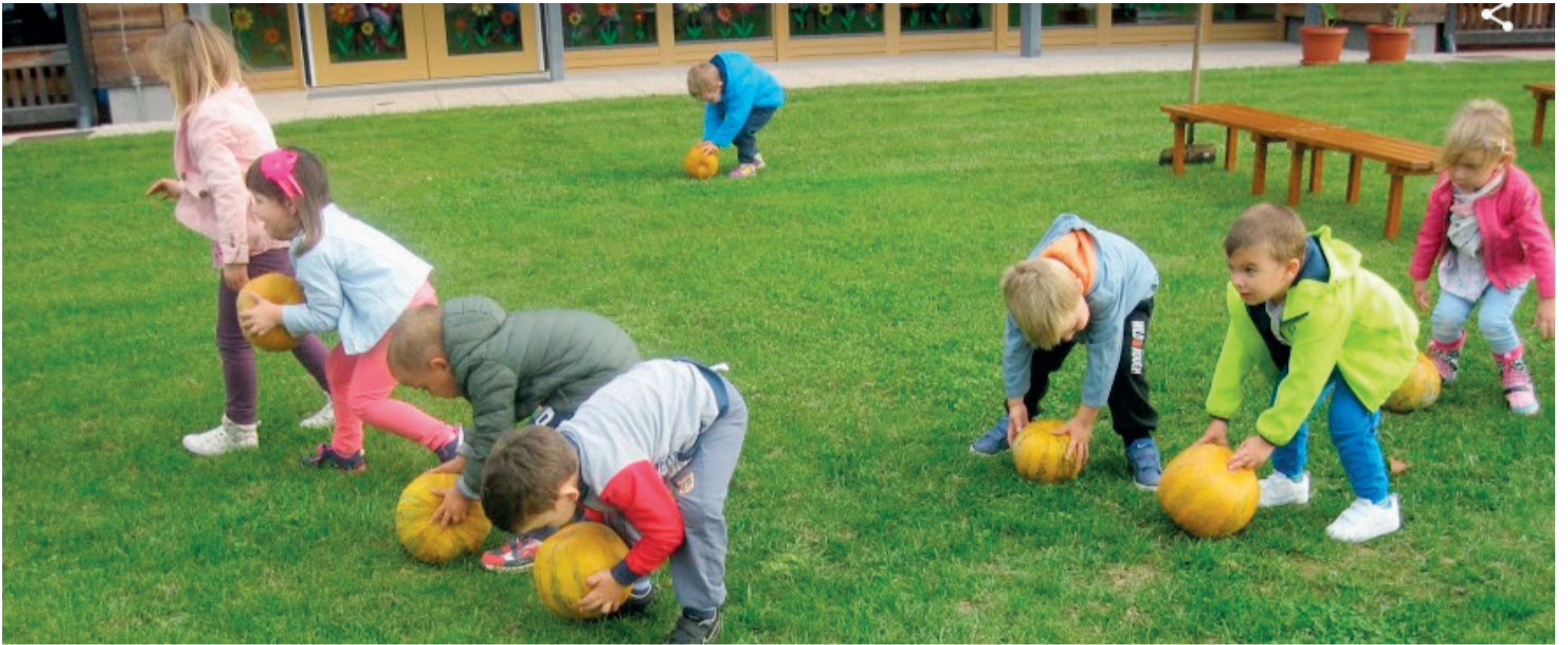
Priprava na trebljenje buč

Jesen je potrkala na vrata z različnimi opravili. V Vrtcu Markovci smo jo z veseljem sprejeli in se zavzeto lotili spravljenih njenih dragocenih plodov. Letošnji Teden otroka smo namreč namenili ohranjanju tradicije, in sicer obujanju starih običajev iz časov naših babic in dedkov. Svoje spretnosti smo preizkusili v različnih kmečkih opravilih. Za spravilo pridelkov nismo potrebovali traktorja ali kombajna, ampak le spretne roke in dobro voljo.