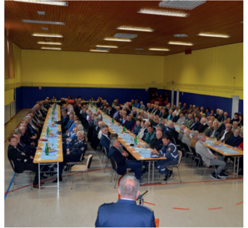
Tokratno srečanje je v organizaciji OGZ Ptuj in PGD Cirkulane bilo v Cirkulanah.