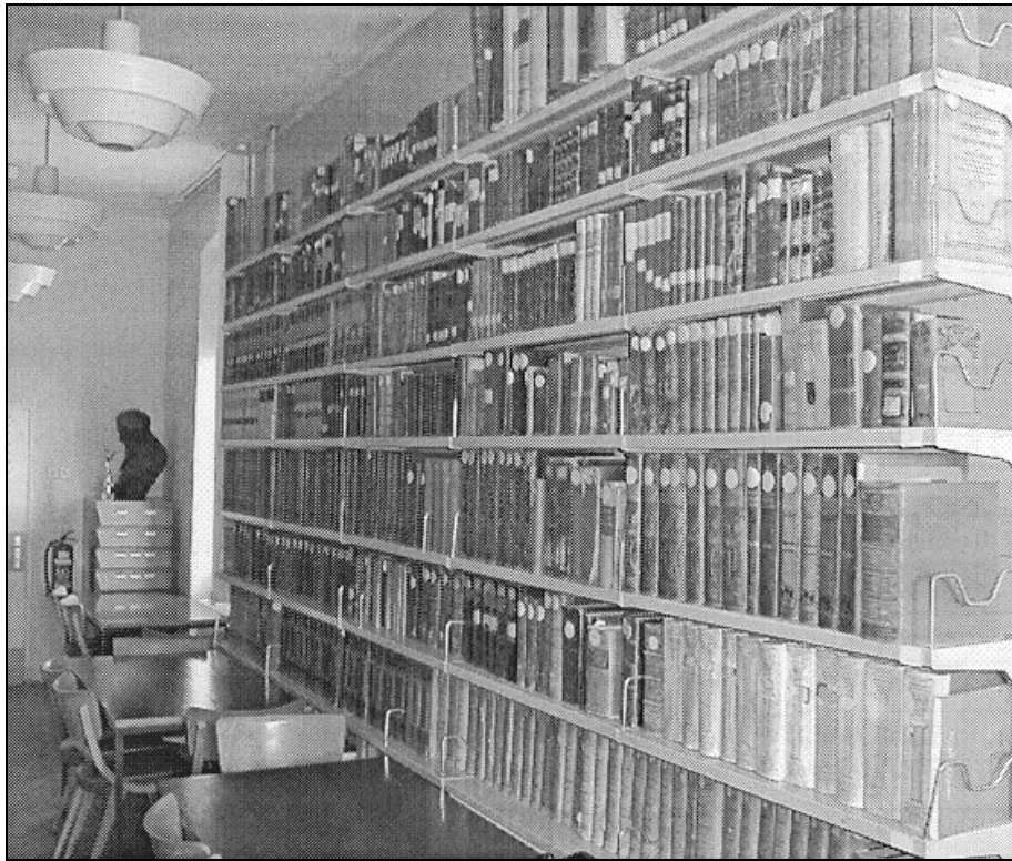
Sl. 1: Knjižnica Gimnazije Gian Rinaldo Carli Koper, bivša Knjižnica Kolegija plemenitašev.

Foto 1: Biblioteca del Ginnasio Gian Rinaldo Carli Capodistria, già biblioteca del Collegio dei Nobili.