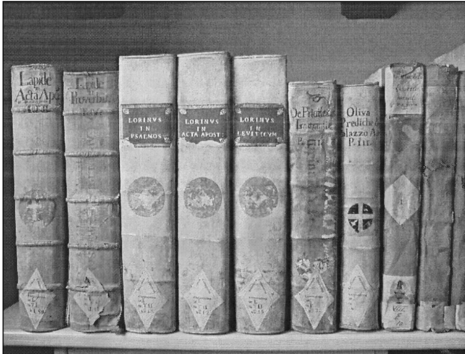
Sl. 2: Knjige z knjižnice kapucinov v Kopru. Foto 2: Libri della Biblioteca dei cappuccini a Capodistria.

Kmalu zatem je neka druga šestčlanska komisija prosvetnega oddelka koprskega okrožja kar šest dopoldnevo pregledovala knjižnico in potem napisala obsežno poročilo o stanju knjižnice v samostanu sv. Ane v Kopru. To poročilo je v arhivu priloženo zgoraj omenjenemu dokumentu in je brez datuma (PAK, IOLO, 1948, 3264/4). Iz poročila povzemam le naslednje splošne ugotovitve, ki se nanašajo na splošno podobo knjižnice: