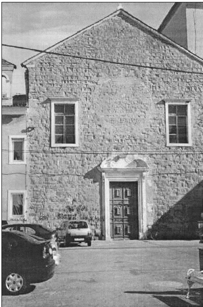
Sl. 3: Cerkev sv. Frančiška v Kopru. Foto 3: Chiesa di San Francesco a Capodistria.