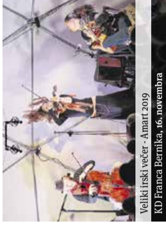
Veliki irski večer - Amart 2019 KD Franca Bernika, 16. novembra