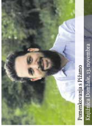
Pomenkovanja s Pižamo Knjižnica Domžale, 13. novembra