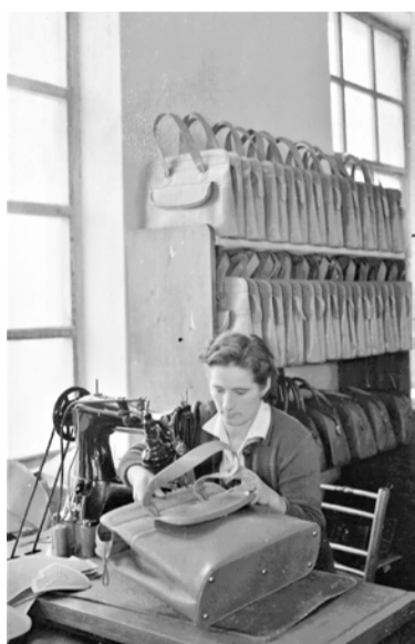
Šivanje torbic v obratu 2, 1955.

N ekdanja delavka v proizvo- dnji drobne galanterije pri- poveduje: »En velik kotel lepila se je kuhaj in vsaka s svojim lončkom smo prišle po vroče lepilo, ki smo ga s čopičem namazale na koščke usnja. Lepo maži, ne prede- belo! Nič nismo smele zapacati z lepi- lom. Hitro smo delale, vse je teklo od mene. Gladiti robove smo si pomagale z gladilniki iz živalske kosti, potem pa se je dalo šivilji zašiti na šivalni stroj. Delali smo veliko nadur, saj smo bili v razvoju. Živeli smo za tovarno, vsi smo bili pripravljani za delo, saj smo dobili plačo, prej pa ni bilo dela.« Naša so- govornica je v TOKO Domžale začela z delom v 50. letih prejšnjega stoletja To je bil povojni čas – čas nove dr- žavne tovarne TOKO Domžale, ki je nastala z združitvijo Zornove tovarne v središču Domžal in tovarne Bratov Okršlar na južnem delu Domžal v obrat 1 in obrat 2.