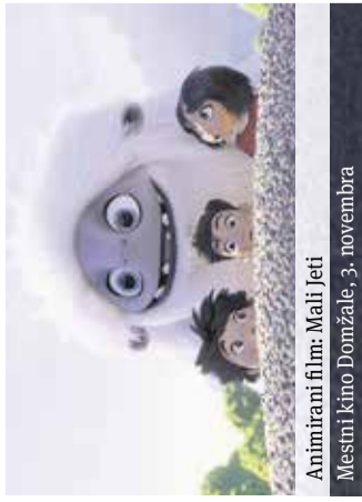
Animirani film: Mali Jeti Mestni kino Domžale, 3. novembra