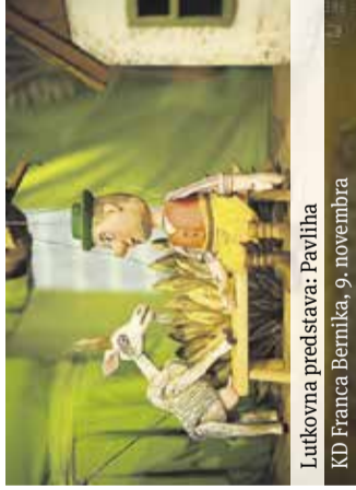
Lutkovna predstava: Pavliha KD Franca Bernika, 9. novembra