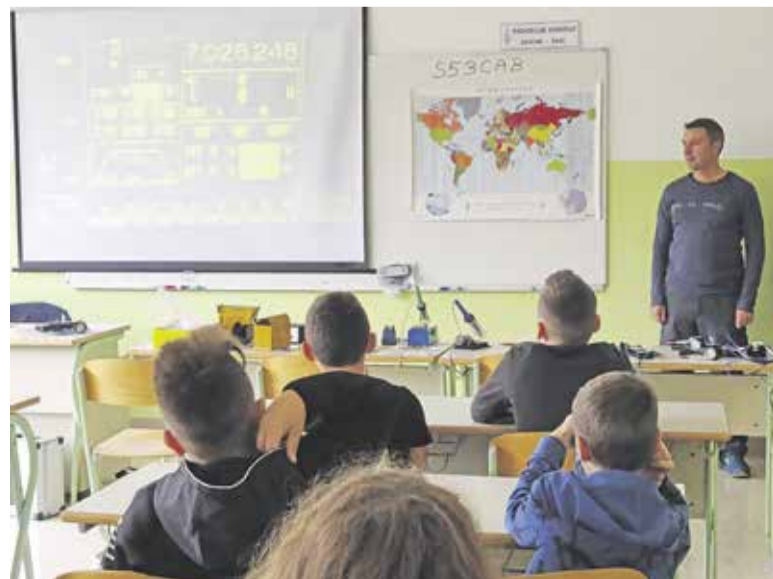
Člani RK Domžale predstavljajo aktivnosti radioamaterjev.

Žal je bil čas v našem razredu prekratek, zato marsikdo ni prišel na vrsto za spajkanje. Zato Radioklub Domžale vabi vse učence, ki bi jih zanimalo, kaj vse počnemo radioamaterji, da se oglasijo v prostorih Radiokluba Domžale vsak četrtek od 20. ure naprej, kjer jim bomo pokazali še več radioamaterske opreme in vrst dela radioamaterjev. Ena takšnih zanimivih vrst dela je tudi delanje zvez s pomočjo odboja od Lune, ali pa odboja od meteorskih rojev in še marsikaj zanimivega boste slišali. Vabljeni vsak četrtek po 20. uri v prostore Radiokluba Domžale na Rodici za trgovino Tuš.