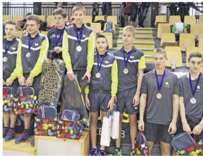
Pogled na zmagovalni oder Kajuhovega memoriala na Kodeljevem je bil za nas res prelep, še posebej v ekipnem tekmovanju, kjer so bili na odru skoraj samo predstavniki našega kluba (NTS Mengeš).