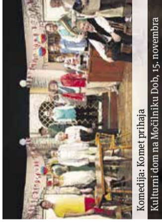
Komedija: Komat prihaja Kulturni dom na Močilniku Dob, 15. novembra