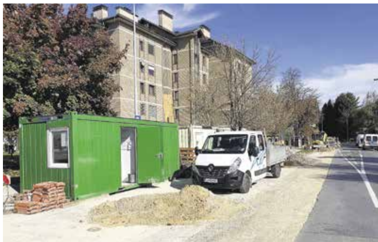
Trenutno se zaključuje obnova vodovoda na delu Ljubljanske ceste, ki je izrednega pomena za zanesljivo vodooskrbo celotnih Domžale.

Vodovodno omrežje v občini Domžale obsega več kot 200 km cevododov in več kot 30 objektov (črpališč, vodohranov...), kanalizacijsko omrežje pa nekaj več kot 180 km cevododov in 45 objektov (črpališč in razbremenilnih objektov). Od leta 2013, ko so bile uvedene omrežnine, je Občina Domžale v sodelovanju s podjetjem Prodnik intenzivno pristopila k sistematičnemu izvajanju obnov, ki so potrebne za normalno delovanje obeh sistemov. Obnova vodovodnega omrežja se izvaja bodisi sočasno z izgradnjo kanalizacije, investicije v tem primeru vodi Občina Domžale, bodisi v sklopu sistematične celovite obnove vodovodnega omrežja, pri čemer