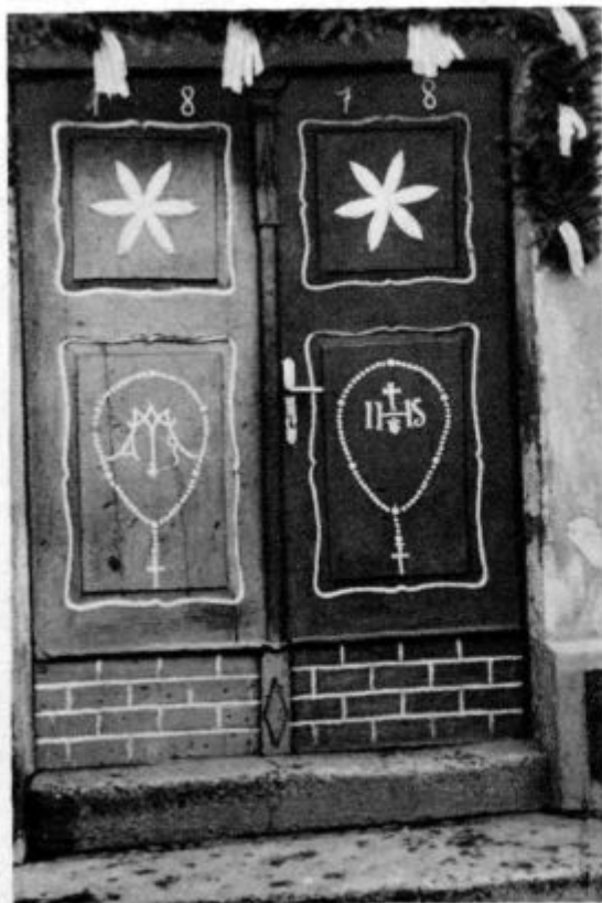
Vrata slovenske hiše na Koroškem s krščanskimi znaki

vetnik, ki je pomagal Filipu pri postavnih predpisih; notar Krasnik z dolgim nosom, ki je sestavil kupni pogodbi; Anton Sova, ki je prevzel klobučarstvo; hkrati še precej tovarišev, sosedov in prijateljic hišne gospodinje, ki je sama kraljevala na zgornjem koncu mize, posuta z biseri, dragimi kamni in svojim novim zlatim nakitom.