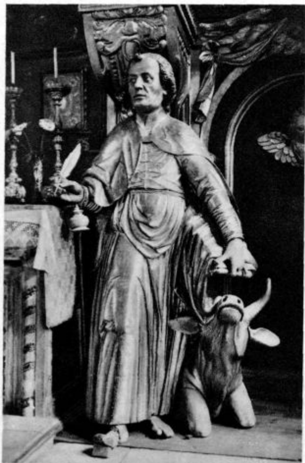
» Sv. Luka evangelist Veliki oltar stolnice v Krki

»O Jesu und Maria, stehet mir bei!« Na levici svetnikovi leži odprta knjiga, v kateri se bere besede: »Am — plius Domi — ne — Am — plius.« »Se bolj, Gospod, še bolj.« Menda je prosil, naj mu Bog še poveča trpljenje. Okrog slike v okvirju pa je prošnja s kronogramom: S. Francisce Xaveri, exaudi me et servos tuos. — S. Franciscus Xaverius adversus aeris tempestates patronus, ora pro nobis. (Sv. Frančišek, usliši mene in svoje služabnike! — Sv. Frančišek, zaščitnik ob hudi uri, prosi za nas!)