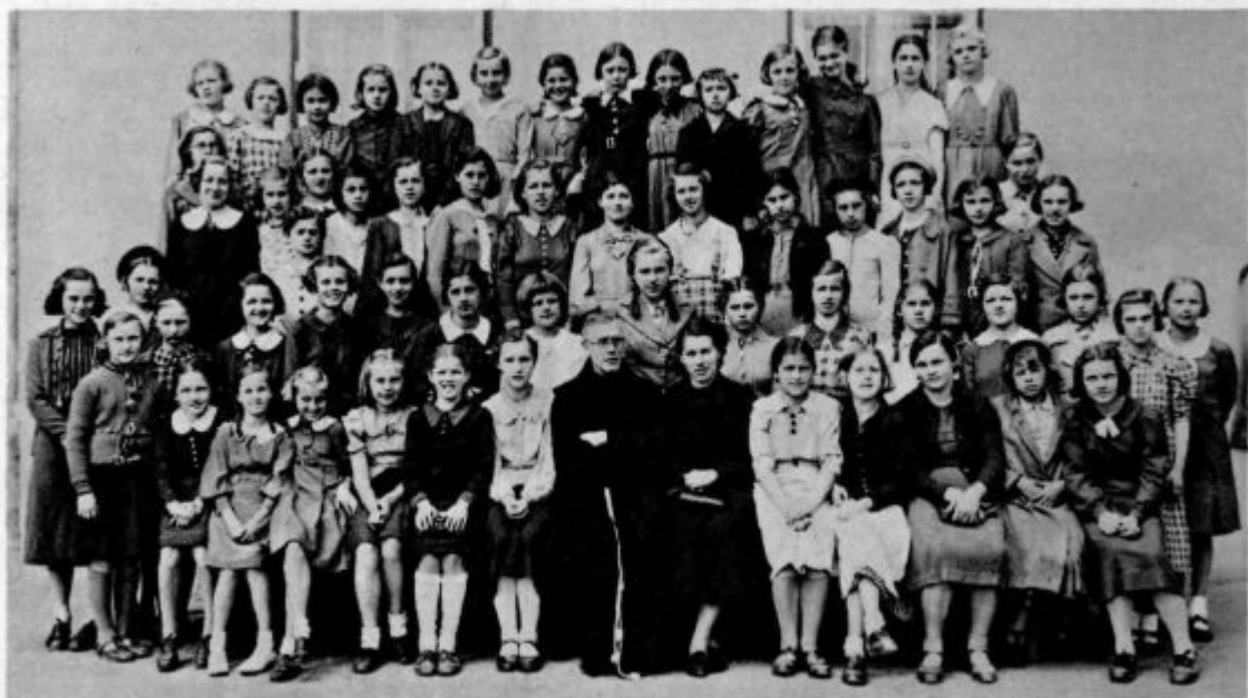
Marijina kongregacija na Viču Dijakinje raznih ljubljanskih šol

»Kaj pravite?« je zavpil Filip, ki je nenadno prebledel, ko je preobračal klobuk v svojih rokah sem in tja. »Saj je tale klobuk prav tisti, ki sem ga onega dne dal gospodu Cirilu, ko je zapustil Neapelj! Še čisto natan-