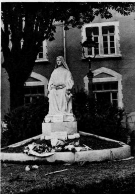
Kip sv. Terezije D. J. v Lizijé-ju

Nad goro pa je v okviru slika umirajočega sv. Frančiška, ki leži na zemlji ob morskem obrežju. Na morju plava barka. Umirajočega svetnika obdajajo angeli. Iz ust mu prihaja vzdihljaj, zapisan v nemškem jeziku: