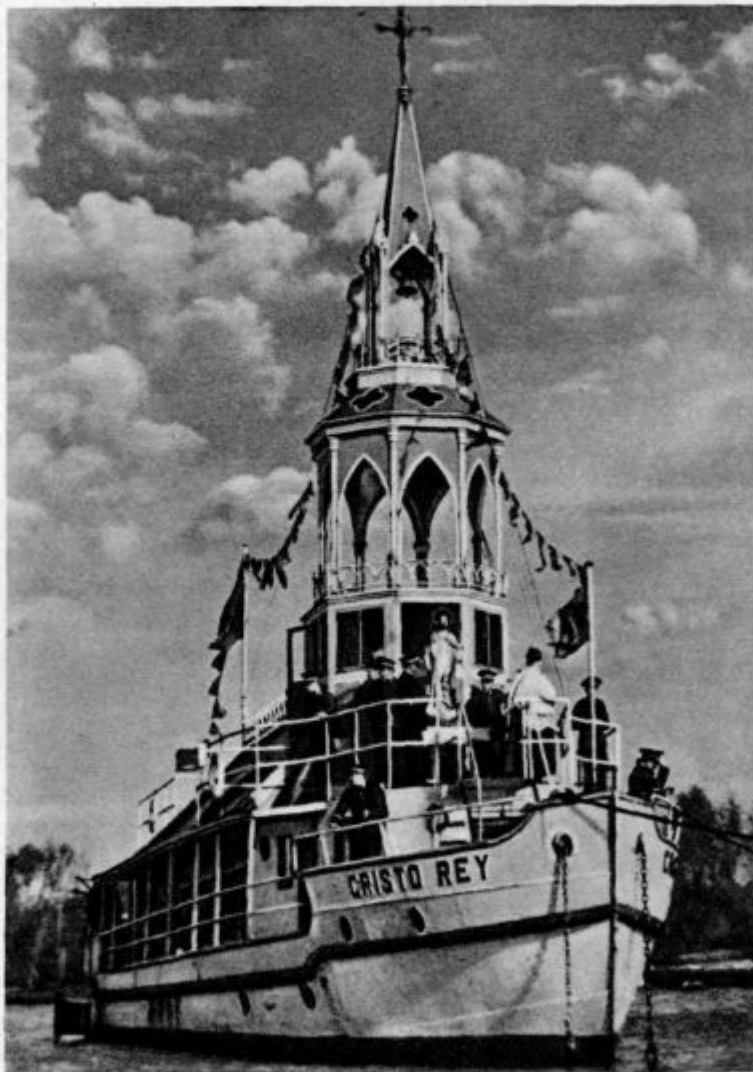
Kristusu Kralju (Cristo Rey)

Razen Filipa samega, njegove žene Klare in otrok so sedeli še okrog mize: izvedenec Kovač, ki je ocenil obrt; Lešnik, zakotni od-