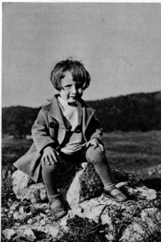
Prid' vrh planin — nižave sin! (Mali „Dobroctan“ na vrhu ob Rakitni)

»Pah! Takole reč naj bi bilo vredno krasti! Klobuk, še najbolj podoben ogoljeni oslovski koži! Pa saj vam ga bom precej prinesel, le počakajte...«