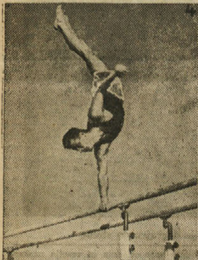
Taka stoja je plod sistematičnega vezbanja

Vsa fizikalna društva in aktivni so dobili točna navodila, kako naj se vršijo in pripravijo letošnji izvenredni občni zbori telovadnih društev, ker se bodo