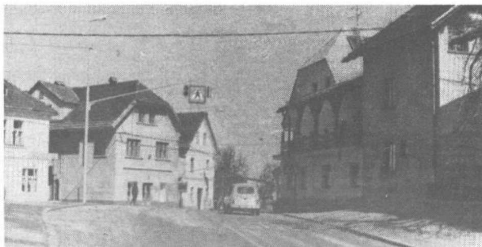
Asfalt je »obdaril« le skromen košček Velikih Lašč