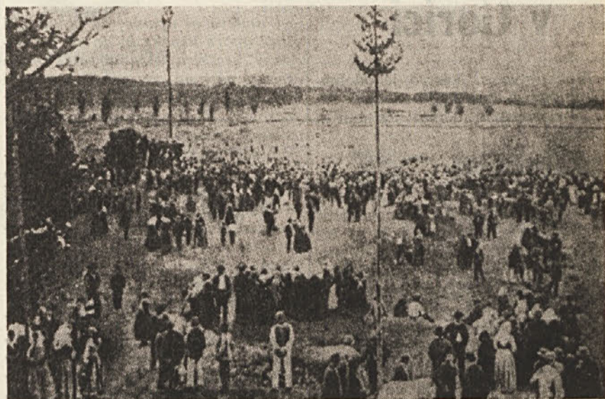
Slika stara sto let. Prikazuje delni pogled na tabor v Sempasu. Preteklo nedeljo je bila posneta nova slika. V Sempasu so svečano proslavili stoletnico svojega tabora. Na veliki proslavi so sodelovali tudi naši pevski zbori z Goriškega in Tržaškega

Leta 1861 je odprla prva slovenska čitalnica v Trstu svoja vrata našemu človeku. Pomembnejša od realizacije je njena ideja. Za tržiško čitalnico so začele odpirati druge, ki so iz večjih trgov seglele tudi v manjša naselja. Leta 1867 so samo na Goriškem našli šest novo ustanovljenih čitalnic. Naslednje leto