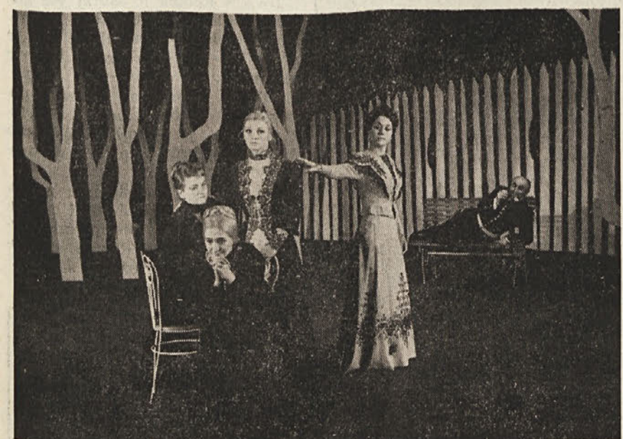
Prizor iz zadnjega dejanja drame Tri sestre, ki jo z velikim uspehom igra Slovensko gledališče v Trstu. Ponovitve drame bodo v soboto, 26. oktobra, v nedeljo, 27. oktobra in v četrtek, 31. oktobra

Burno pozdravljen je poteni izražal zahteve tabora, ki so bile v nekem smislu odločnejše od zahtev, ki sta jih postavljala predhodna tabora v Ljutomeru in Zalcu, razen tega pa vsebujejo zahteve tudi slovensko visoko šolo. V ponatisu posebne knjižice, ki jo je izdal ob taboru E. Klavžar, beremo, da je doživel tabor v tedanjem tisku velik odmev. To je organizatorje spodbudilo k nadaljnjemu boju za narodnostne pravice Slovencev.