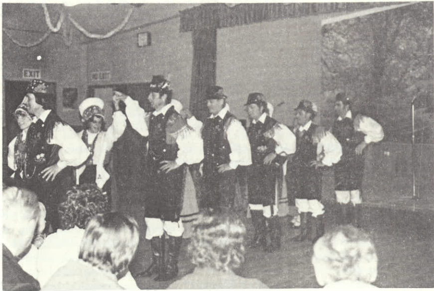
Slika zgoraj naša folklorna skupina ob nastopu v Geelongu.