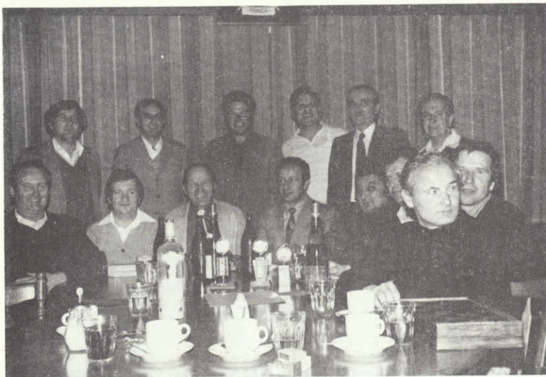
Slika zgoraj je lep dokaz kako razpolozenje je bilo na prvem sahovskem srečanju z S.D.M.