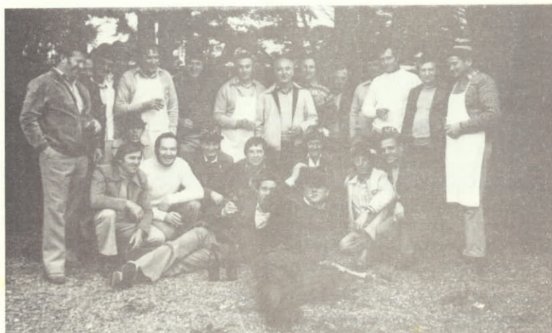
Veliko razpoloženje naših lovcev na Jelenovi pojedni.