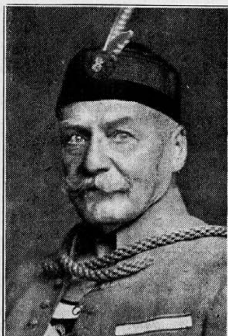
Brat dr. J. Vaniček

ČOS punih 38 godina. Kolike su njihove neocenjive zasluge za Sokolstvo kod svih Slovena, nije nam moguće potanje izneti na tom ograničenom prostoru.