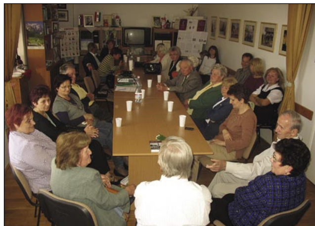
Starejši in mlajši mislijo, ka so potrebne takšne knjige

Knjiga Vtrgnjene korenjé je žalosna knjiga, pa donk po-