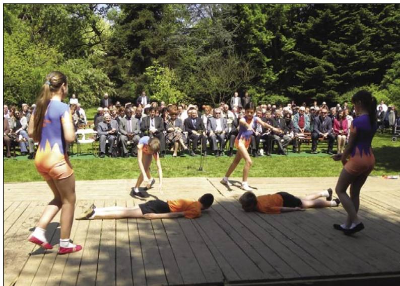
Pogled na del bogatega kulturnega programa in številne obiskovalce

povezovanje in tudi mladost so bile besede, ki so jih po-