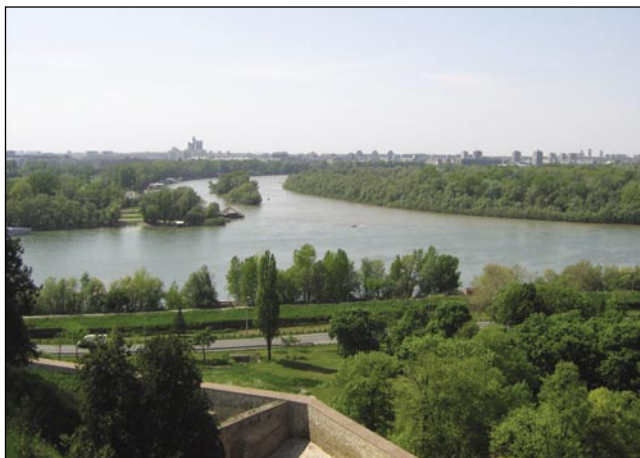
Gde Drava pa Sava vküpertečeta...

Skoro prazni panauf v Budimpešti, tū pa tam nekaj spi na šurki stolicaj, en par mladi z veukimi ruksauki. Vōra je že včasi pau dvanajset vnoči, mojiva pajdaša pa sta eške nindri nej. Pet minutov pred odpelanjom končno nutpotisnejo cug za