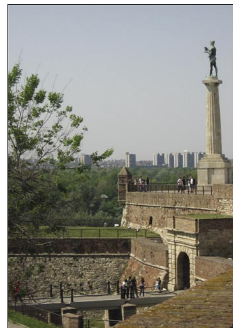
Kip na Kalemegdani kaže mauč Srbov

nji tau grada, vidimo kip (szobor), s šterim Srbi valo davajo Francuski za pomauč v vsej bojnaj, v šteraj je srbski narod trpo. Na vse té bojne spominajo veuki štüki pa tanki z več rosagov, šteri so vōpostavljeni pred