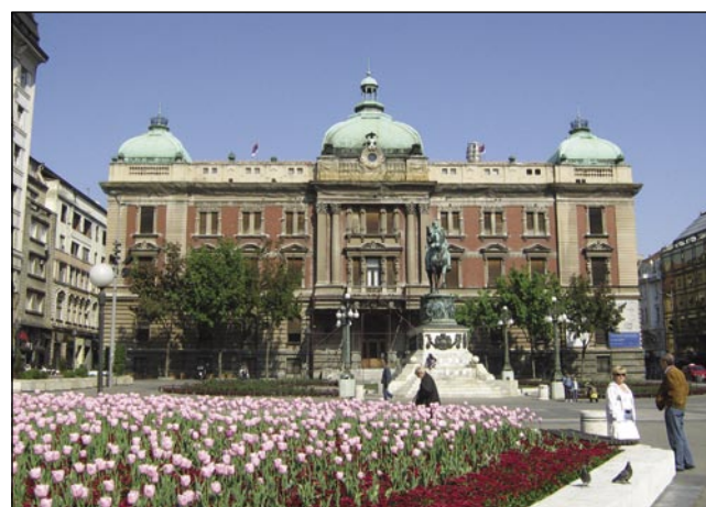
Trg Republike z Narodnim muzejom

v cirilski literaj: Београд. Tau sta leko mojiva dva padaša ranč tak preštela, vej sta se v mlašeči lejtaj rusoški včila. Če se človek vnoči pela s cugom, leko več aktivni dni »prišpara«, samo se more cüjvzeti, ka je cejli den trüden pa ka na ulicaj zrankma