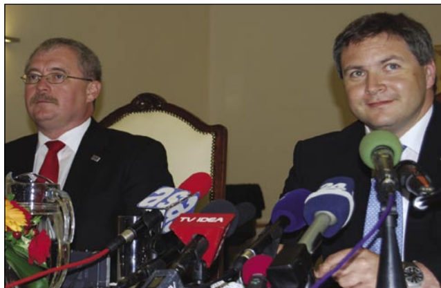
Madžarski in slovenski kmetijski minister Sándor Fazekas in Dejan Židan

»Madžarskemu kmetijskemu ministru sem se zahvalil, saj je zlasti njegov način vodenja pripomogel h kompromisu, tako da smo na zad-