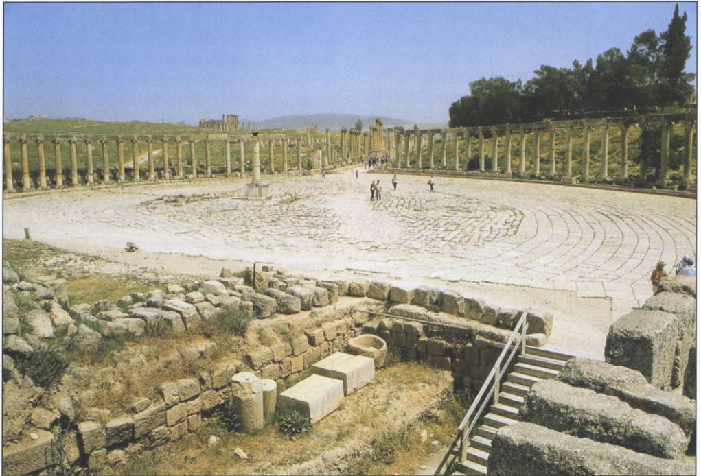
Slika 1: Rimljani so na ozemlju današnje Jordanije zgradili številna mesta, med katerimi je najpomembnejša Gerasa oziroma Jerash.

V 7. stoletju je ozemlje prešlo pod arabski nadzor, ki je s posameznimi posledki (na pri-