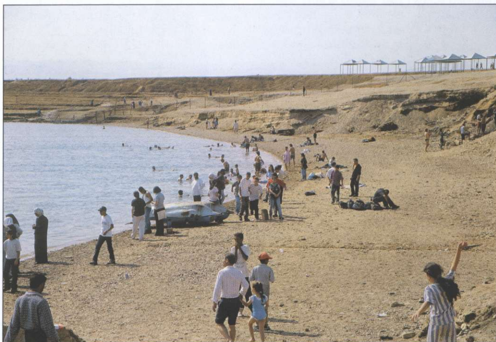
Slika 2: Mrtvo morje je najnižja točka na svetu, saj leži približno 400 metrov pod gladino morja.

Sodobno zgodovino Jordanije je močno zaznamoval kralj Husein, ki je državo vodil med letoma 1952 in 1999. S politično karizmo in ugledom je državo uspešno vodil ter jo preobrazil v nekakšen most med tradicionalnim arabskim svetom ter razvitim Zahodom. Po njegovi smrti ga je nasledil sin Abdulah, pred katerim so številni izzivi sodobnega sveta. Med političnimi izzivi sta v ospredju prizadevanje za ureditev palestinskega problema in odnosi s sosednjim Izraelom.