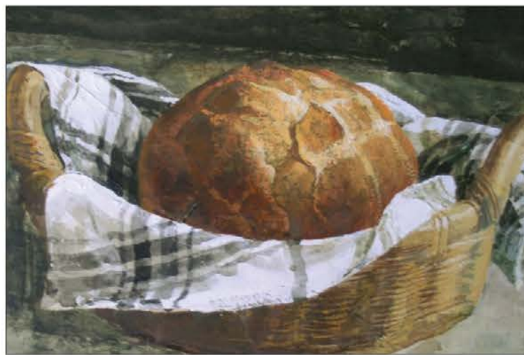
Safet Zec: Kruh, olje in tempera na platno

pri sv. maši, niti zgolj z lepimi in pravovernimi besedami, niti zgolj s kritičnim presojanjem nepravilnosti v državi, Cerkvini svetu. Prav tako krščanske svetosti ne dosežemo samo z raznimi askozami, niti zgolj z radikalnim