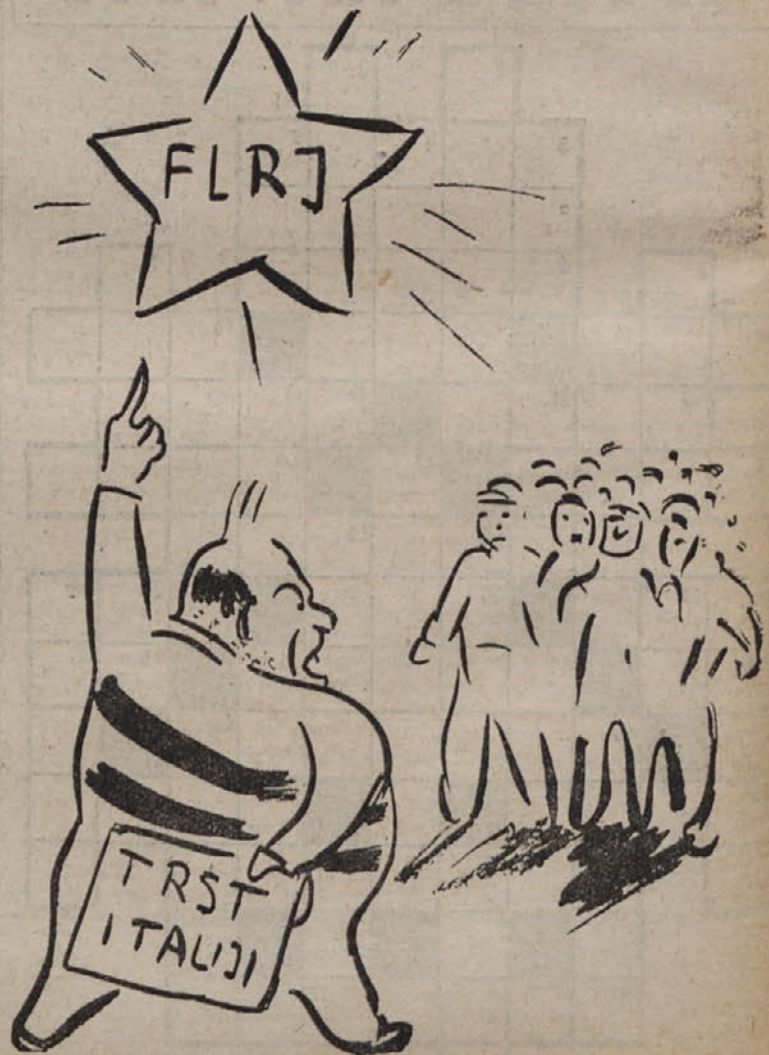
Poglejte jugoslovanske imperialiste! toliko jim je mar za mirovno pogodbo, da niti italianissime cone B nečejo odstopiti naši Italiji