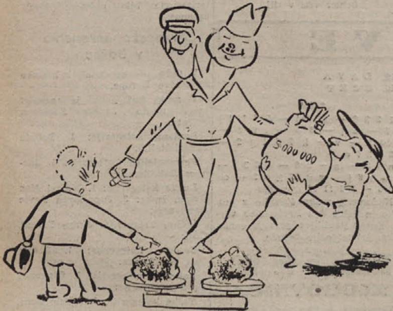
ZVU: Bogu kar je božjega in kmetu, kar je kmetovega!

Medtem ko našim kmetom še vedno niso izplačali odškodnine za njihov teren, preko katerega je vojaška uprava speljala cesto, pa so tržaški škofiji za majhen in malo vreden teren izplačali naravnost velikansko vsoto