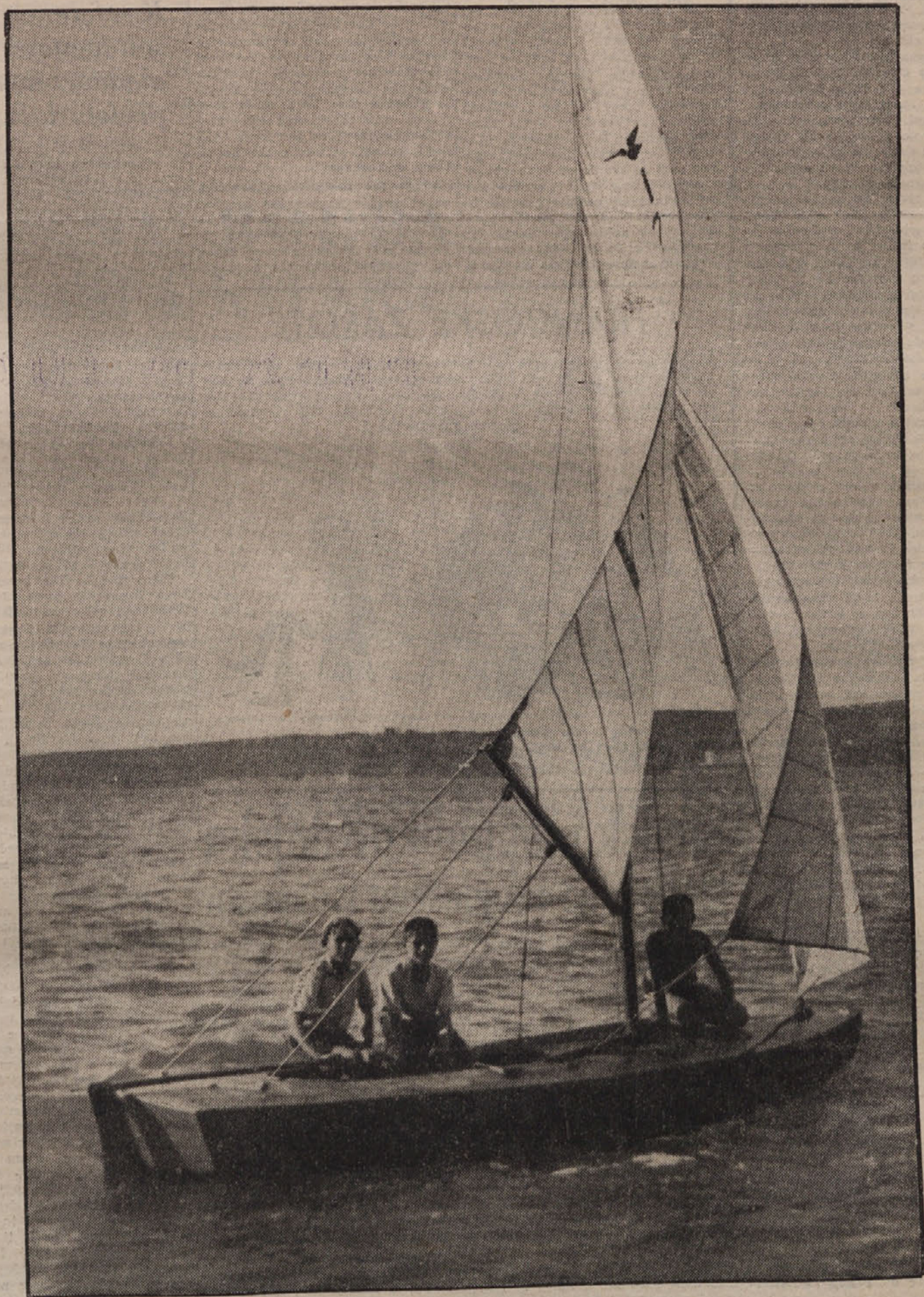
PROTI SV. NIKOLAJU