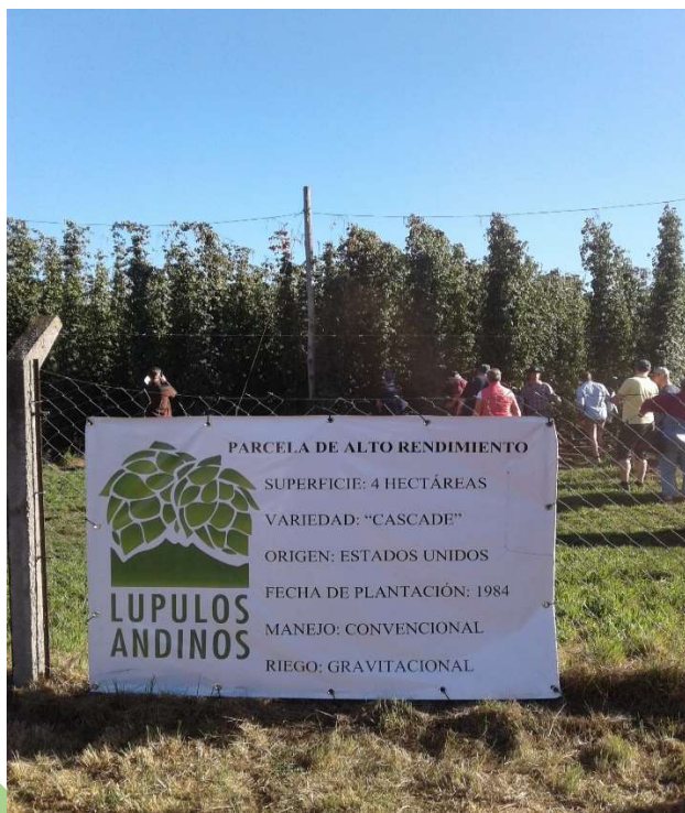
Ogled argentinskega hmeljišča

Na južni polobli pridelajo hmeljarji 4 držav (AR, AU, NZ, ZR) svoj pridelek že v marcu - trenutno 3,4 % celotne svetovne pridelave. Po obisku Južnoafriške republike (2000) ter Avstralije in Nove Zelandije (2002 in 2011), so v letu 2020 prvič v zgodovini organizacije dogodek gostili hmeljarji iz Južne Amerike. Ščepec soli v zgodbi ilustrira izbrani termin strokovne poti, vezan sicer na tamkajšnje obiranja hmelja konec februarja, nevedoma pa še pravočasno pred pričetkom poglavja zgodbe novega svetovnega reda, ki je že dober teden kasneje vedeno povsem spremenila globalni tok poslovnega sveta in naše običajne vsakdanjosti.