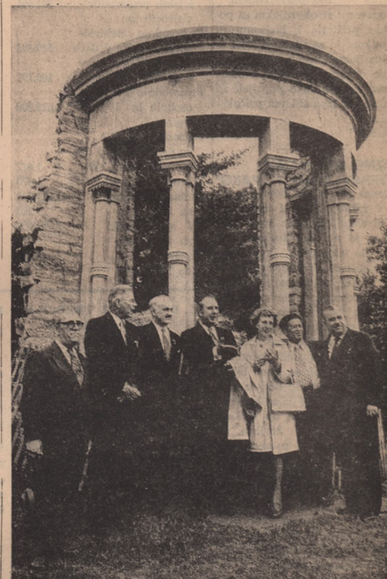
Na oddimu v Gatineau hribih severno od Ottawe. Park je daroval državi (in ga dal tudi primerno "okrasiti" z "razvalinami" preteklosti. nekdanji min. predsednik McKenzie King.