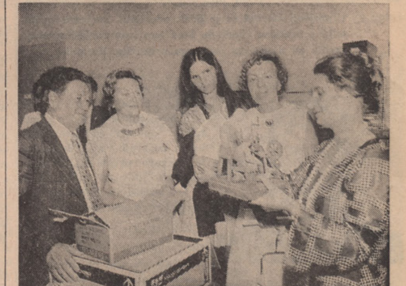
Ogled kolovrat modela. Marsikaj je še v zabojih, drugo je v pripravi. Muzej bo odprt publiku v dobi 2 let.