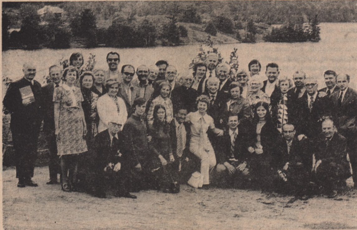
Ob reki sv. Lovrence—"tisoč otokov". Na sliki so vsi udeleženci deveture urednikov etničnih listov iz Ontario — v juniju letos.