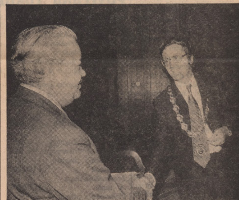
Predsednik E.P.A.O. izročja knjigo o 20. letnici županu mesta Peterboro.

Iz Ottawe smo odpotovali na obis "Atomic Energy plant" v Chalk River, v Ottawaski do- lini, kjer smo se zadržali ves dan, od tu pa narej na ogled posebnosti v North Balu in od tu spet domov v Toronto! — Ker pač slike več povedo kot kopicica besed iste tu objav- ljam, da tako med bralci vzbud- imo interes za obisk istih. Na tem mestu pa tudi izrekon zahvalo Ont. turističnemu ura- du za vsjo pomoč in vodstvo ture. —V.M.