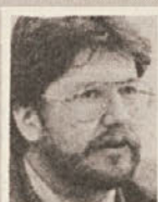
● Igor Bavčar, notranji minister in predsednik Demokratične stranke