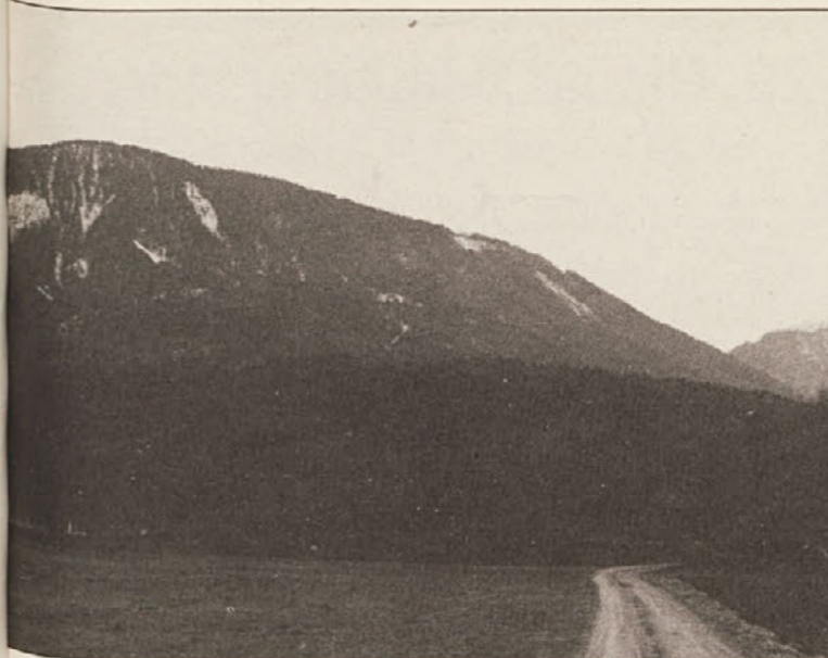
Ali bodo tu med Podsinjo vasio in Št. Janžem že v kratkem gramozne jame? Občani se borijo za svojo življenjsko kvaliteto in nasprotujejo takim načrtom.

Vsekakor pa bi pomenil tak projekt tudi močan poseg v naravo, katerega nikakor ne moremo zagovarjati.