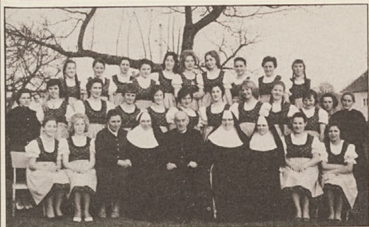
Gospodinjska šola Št. Rupert: