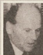
● dr. Jože Pučnik, predsednik Socialno-demokratske stranke Slovenije