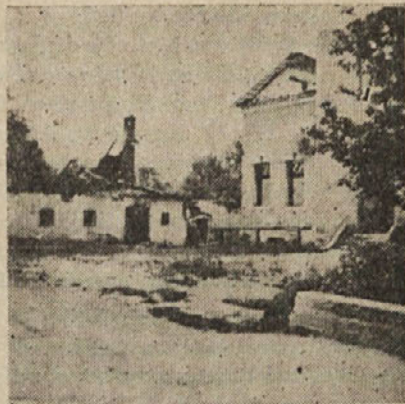
PORUŠENI SLOVENSKI DOMOVI

cija se ni zedinila z Anglijo in vse kar je bilo storjeno, je bilo to, da je Društvo narodov napovedalo gospodarski bojkot napram fašistom. Prvi Hitlerjev marš je bil leta 1936 v demilitizirano Rensko dolino. Nihče se ni zganil. Francija je sicer delno mobilizirala in pri tem je ostalo. Sledila je španska civilna vojna in vse je izgledalo, da je Španija postala teren, kjer so se vodili manevri za bodočo vojno. Na tem terenu so se tudi prvič srečali nacisti s komunisti. Leta 1938 je bila zasedena Avstrija in priključena „velikemu Reichu“. Hitler je prišel sam na Dunaj in druga avstrijska mesta, kjer je bil sprejet z največjim navdušenjem. Hitler je šel dalje in dalje. Pod pretvezo, zaščititi pravice sudetskih Nemcev, je zahteval od Češke obmejne predele. To njegovo požrešnost sta podprli tako Anglija, kakor tudi Francija. Prav je, da se spomnimo znane pogodbe v Monakovem, ki je bila podpisana 30. septembra 1938. Mussolini in Hitler na eni strani, Chamberlain in Daladier na drugi. Češki predsednik dr. Beneš pa je prosil zapad za pomoč, ki je jasno bila odklonjena.