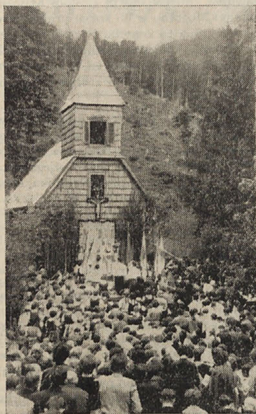
Mladina iz Roža se je zbrala v gorski kapeli na Sedlcah (Glej poročilo na 7. strani)