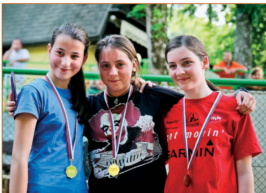
Zmaga je sladka, prijateljstvo pa večno.