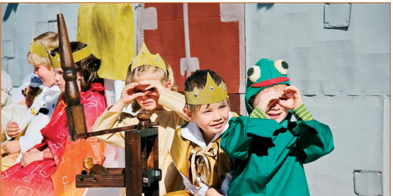
Otroci so se lepo vživeli v svoje vloge.