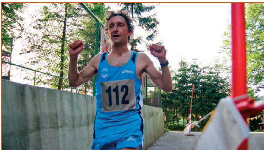
Malo utrujen, a zadovoljen.