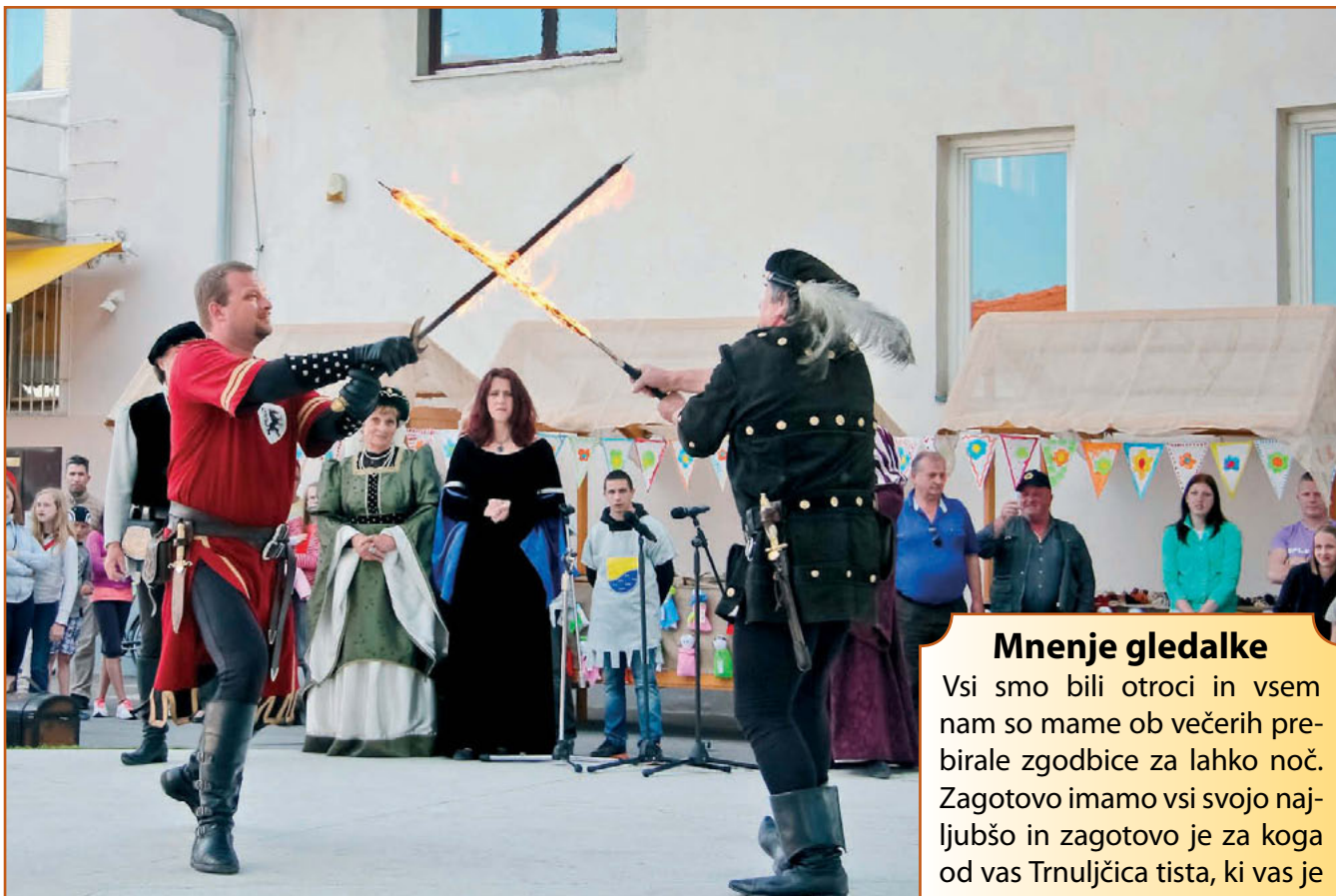
Videti je bilo celo srednjeveški boj.