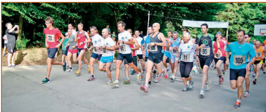
In začel se je tek za pokal Gorenjskega odreda