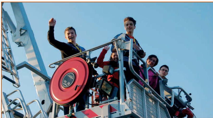
Pogled z lestve

Pred večerjo je bilo odprtje simpozija, ko nas je nagovoril predse-