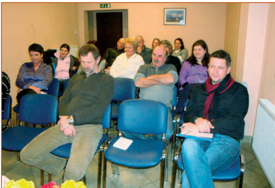
Zbor Biser si želi moških glasov.