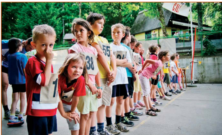
Tudi najmlajši so se izkazali.