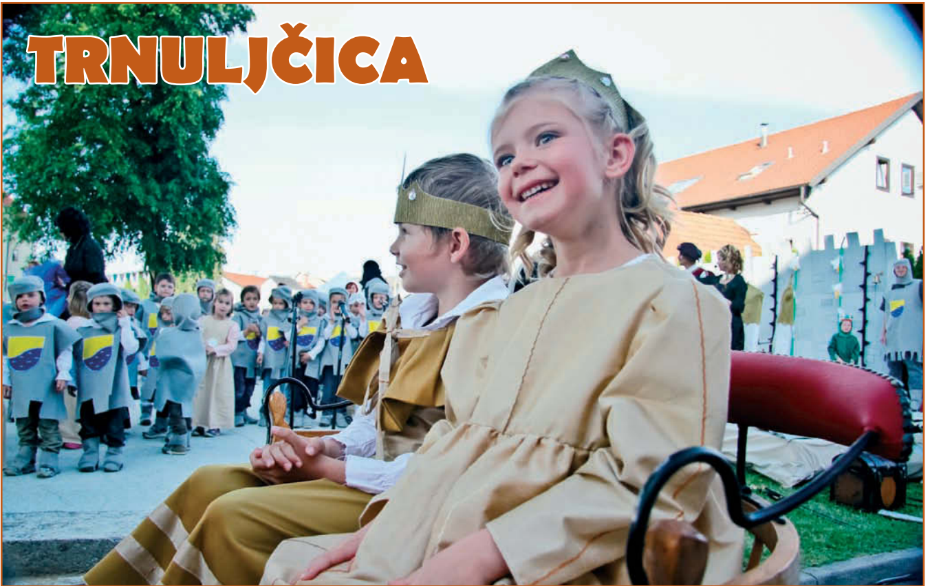
Veličastna pravljica sredi Vodice

V letošnjem prazničnem letu našega vrtca smo v okviru obogatitvenega programa izvajali številne projekte, tudi celoletni projekt Nekoč je stal grad, s katerim smo sklenili praznovanje 50. obletnice delovanja vodiškega vrtca. Projekt smo končali z igro Trnuljčica, ki smo jo 18. maja izvedli na prostem,