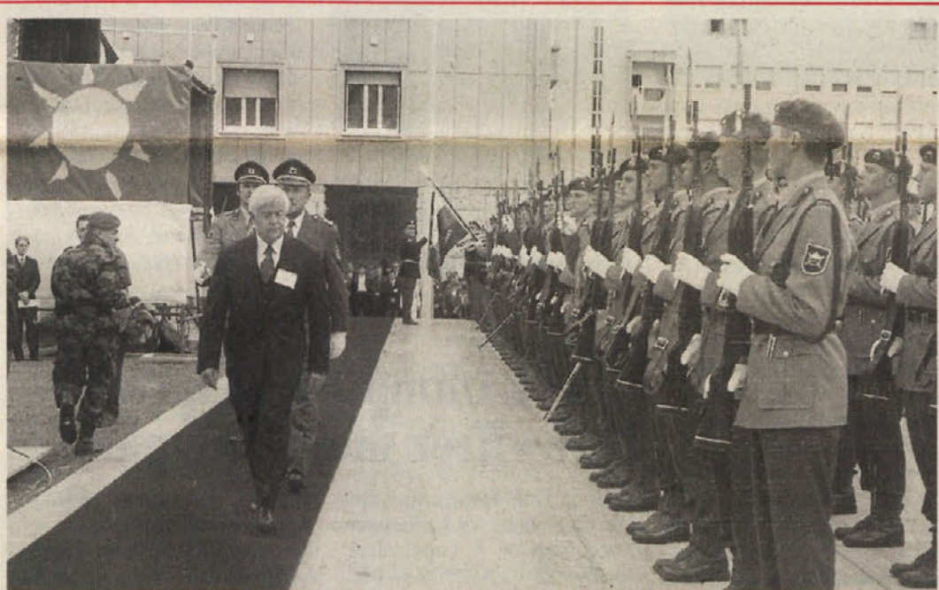
Najvišji predstavniki slovenske države s predsednikom Kučanom na čelu, slovenska vojska in regionalne organizacije so na svečani prireditvi proslavili 50. obletnico priključitve Primorske k Sloveniji. Preberite poročilo na 4. strani.