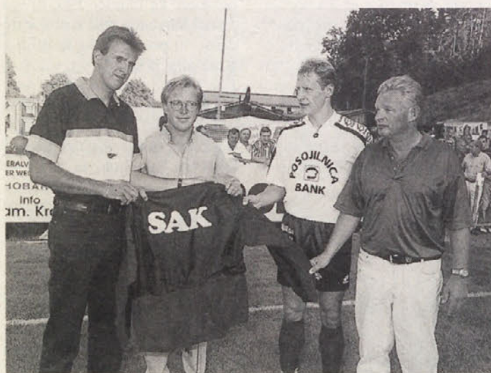
SAK je prejel nove trenirke