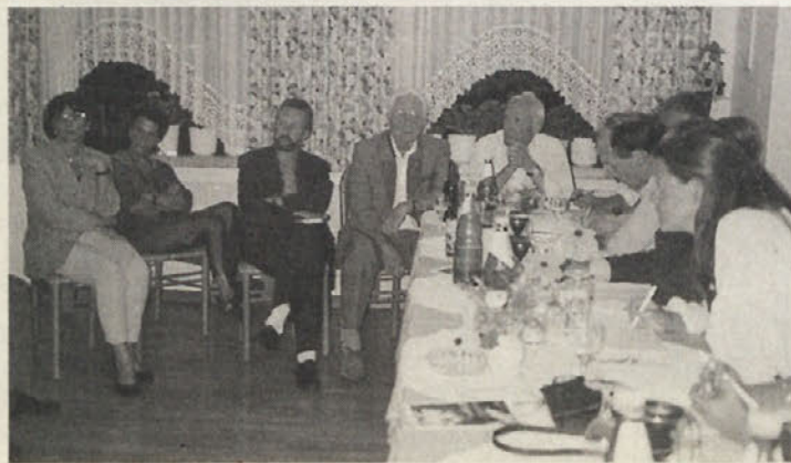
Udeleženci konference so se pogovarjali tudi zastopniki slovenskih organizacij, Heimattiensta in brambovcev