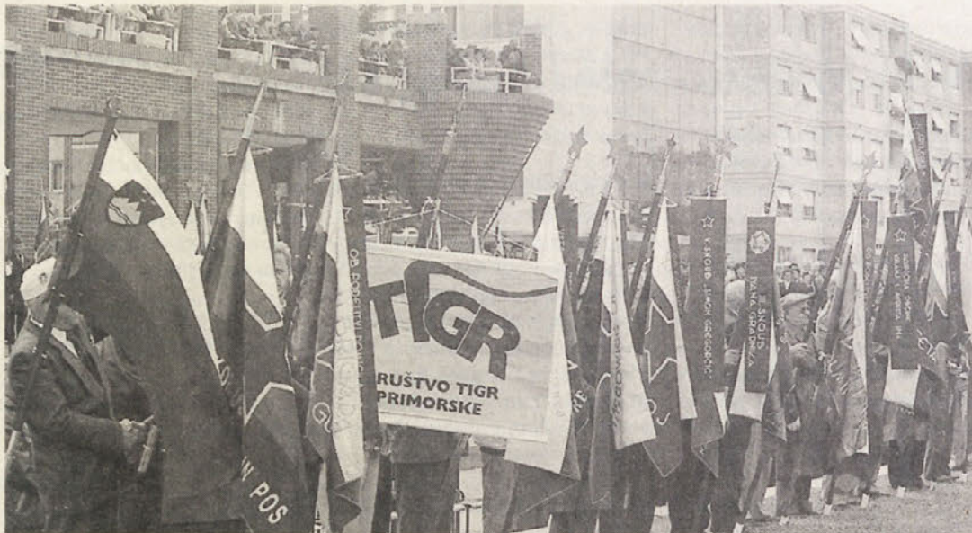
Prapori TIGRa in zamgovitih partizanskih čet so plapolali v vetru

Na Prešernovem trgu, kjer stoji pesnikov kip, je bila v soboto, 13. septembra, slovesna prireditev v spomin na vrnitev Primorke. Ljubljanski župan Dimitrij Rupel je dejal, da Slovenije brez Primorske ni in da bi morala Ljubljana biti do Primorske in njenih ljudi bolj pozorna. V osrednjem večernem programu je nastopil Tržaški partizanski zbor in množico zbranih navdušil s partizansko pesmijo. Sploh je ta