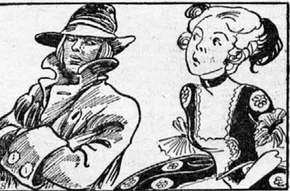
»Kakšna dolgočasna zadeva,« je dejala princeska. »Potem pa ve stojte okrog mene, da me vsaj nihče ne vidi!«