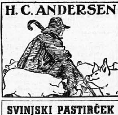
H. C. ANDERSEN SVINJSKI PASTIRČEK