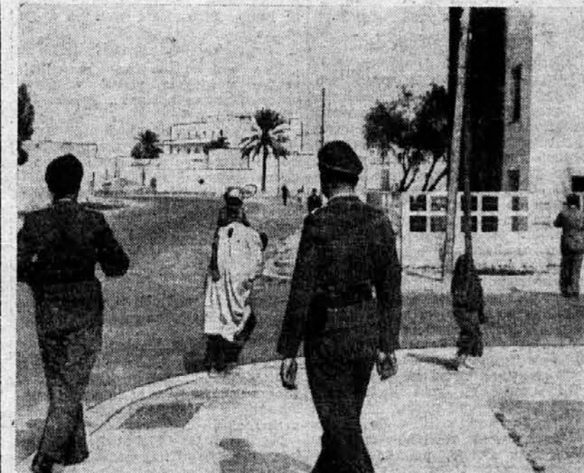
Pogled na pristanišče v Tripolisu, ki je bilo izpostavljeno hudim angleškimi letalskim napadom, zdaj se pa po njem sprehajajo nemški letalci.

Srednjim in mešanskim šolam izven Ljubljane razpošlje tiskovine za spričevala Banovinska zaloga šolskih knjig in učil sama na račun.