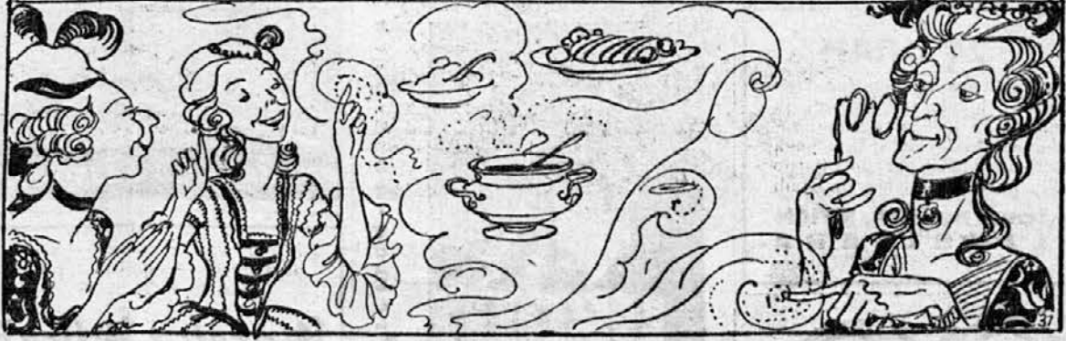
»Zdaj vemo, kje jedo sladko juho in jajčni kolač, zdaj vemo, kje sta na mizi pečenka in kaša! Kako je vendar to lepo!«