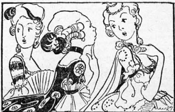
»Hvala lepa,« je odgovoril pastirček, »deset poljubov od princeske ali pa obdržim lonček.«