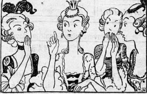
»Da, toda molči, kajti jaz sem cesarjeva hči!« »Da, da,« so vse v en glas odgovorile. Svinjski pastirček — prav za prav princ, toda zanje je bil svinjski pastirček, saj niso vedele, da je princ — ni pustil, da bi mu dnevi bežali kar