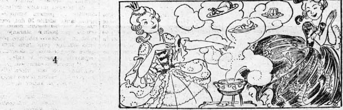
Oh, kakšno veselje je bilo to! Ves večer in ves dan je moral lonček vreti; in v vsem mestu ni bilo ognjišča, o katerem ne bi vedele, kaj se kuha na njem, pa najsi je bilo to čevljarjevo ognjišče ali pa komornikovo. Dvorne dame so pa plesale in ploskale