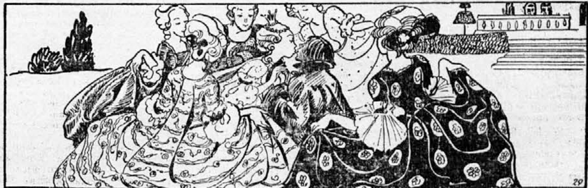
Dvorne dame so se postavile okrog nje in razširile svoja krila. In tako je dobil svinjski pastirček deset poljubov, princeska pa lonček. Za tedaj sta bila oba zadovoljna.