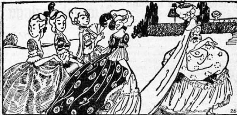
»Poslušaj,« je dejala princeska, »vprašaj ga, ali hoče deset poljubov od mojih dvornih dam.«