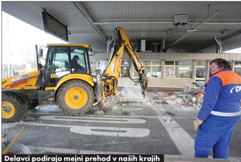
Delavci podirajo mejni prehod v naših krajih

po pičlih šestih mesecih motiva- cij in sklicevanja na upravičeno zgodovinski dogodek premalo, da bi lahko konstruktivno peljali naprej tako dolgoročen čezmejni projekt? Sprehod "Onkraj" po ju- tranjih opravkih, nakupih in polnjenju bencina ter, obratno, sobotne akcije megashoppinga v