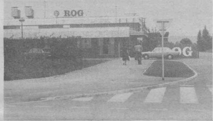
ROG — Taka je zunanost novega Rogovega tozdr Finalizacija

JULON — Čeprav so v novem Julonovem proizvodnem obratu do sedaj že montirali več kot polovico opreme, s poskusno izdelavo sintetičnih vlaken ne bodo pričeli v začetku novembra, kot so sprva načrtovali. Zataknilo se je namreč pri uvozu nekaterih strojev in tako bo prva linija pričela poskusno obratovati predvidoma v prvih mesecih prihodnjega leta. Na sliki: Ekstraktorji, v katerih bodo izpirali granulnat za grobo svilo