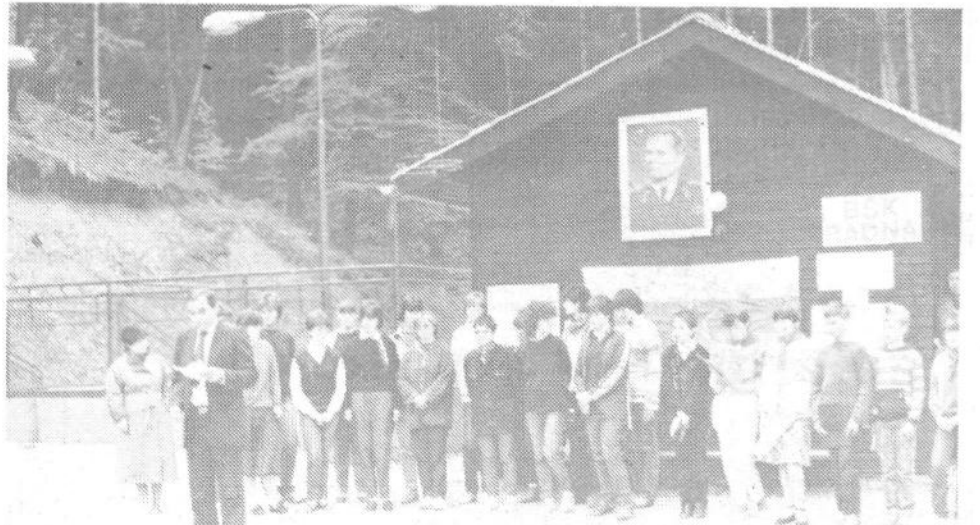
SLOVESNOST OB LETOŠNJIH JUBILEJIH – Na Brezovici si še niso izbrali datuma za krajevni praznik, 40-letnico osvoboditve pa so vseeno proslavili.