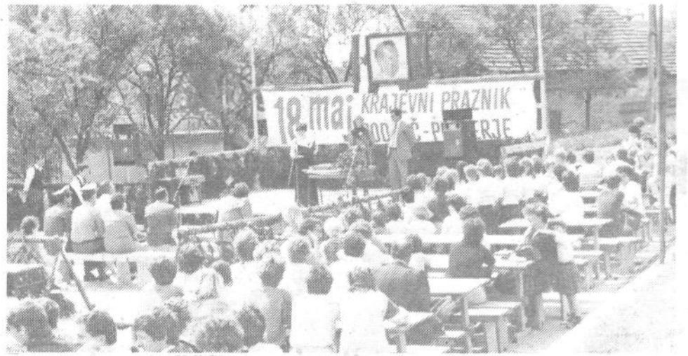
V KS PODPEČ-PRESERJE JE BILO SPET SLOVESNO – Ni še bilo leta, da se na slovesnosti ob krajevnem prazniku ne bi zbralo nekaj sto ljudi.

PRIPRAVLJALNI ODBOR ZA IZVEDBO KRAJEVNEGA PRAZNIKA