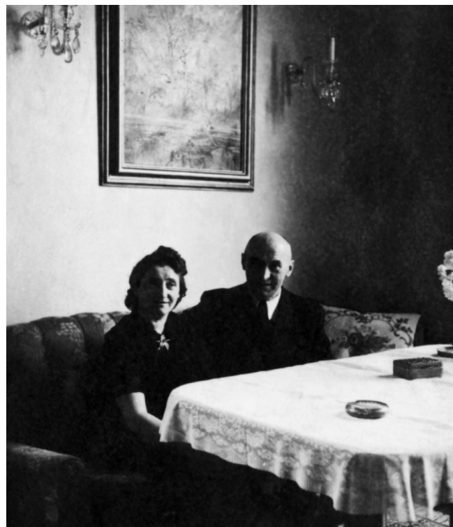
Zakonca Hutter v gospesni sobi.

stanovanju v Hutterjevem bloku, kamor sta se z mamo preselila po zaplembi, nato pa se je iz rodnega mesta izselil. 10