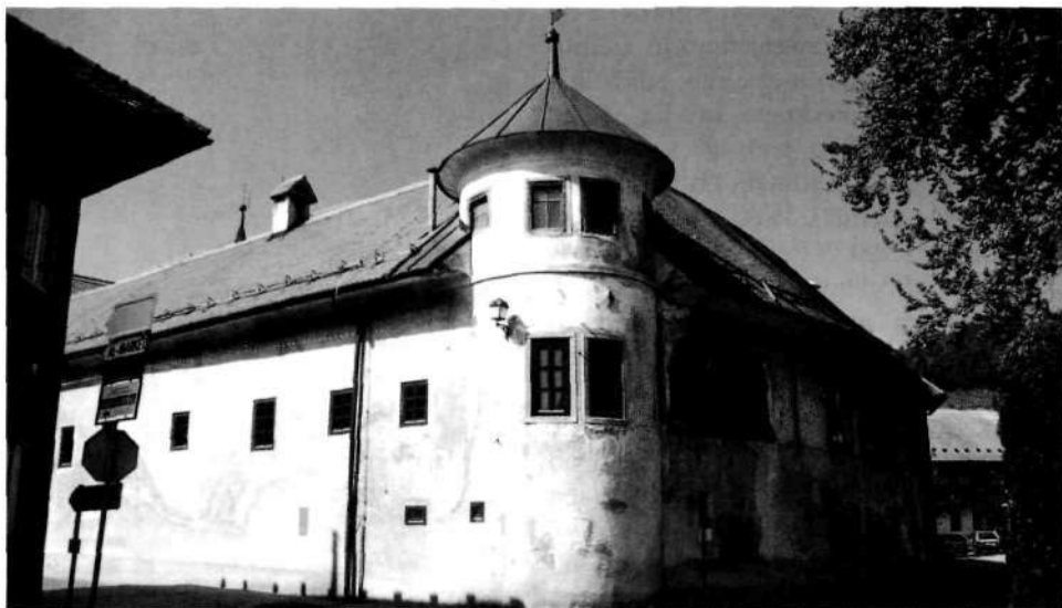
V Puštalskem gradu so bile zbirke od leta 1946 do 1959

Zbirke v Loškem gradu: Zaradi naglega razvoja muzeja v letih 1946–1959 so prostori v Puštalu postali pretesni. Občina je zato Loškemu muzeju v izpraznjenem