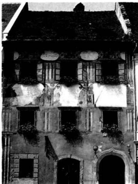
V Rotovžu na Mestnem trgu so bile muzejske zbirke od leta 1939 do 1941