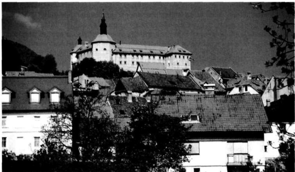
Od leta 1959 so zbirke v Loškem gradu

Loškem gradu namenila 36 prostorov, ki jih je muzej uporabil takole: 18 prostorov za zbirke, 9 za skladišča (depoje), 2 za arhiv, 1 za študijsko sobo, 3 za pisarne in 1 prostor za delavnico. Kljub razširitvi zbirke je tudi v novih prostorih obveljala še vedno osnovna razvrstitev posamičnih zbirk. To pomeni, da so odborniki Muzejskega društva in prvi poklicni ustvarjalci Loškega muzeja že pri prvi postavitvi dosegli visok strokovni nivo in politično neoporečnost za vse družbene sisteme, kar velja seveda tudi za današnje postavitve zbirk.