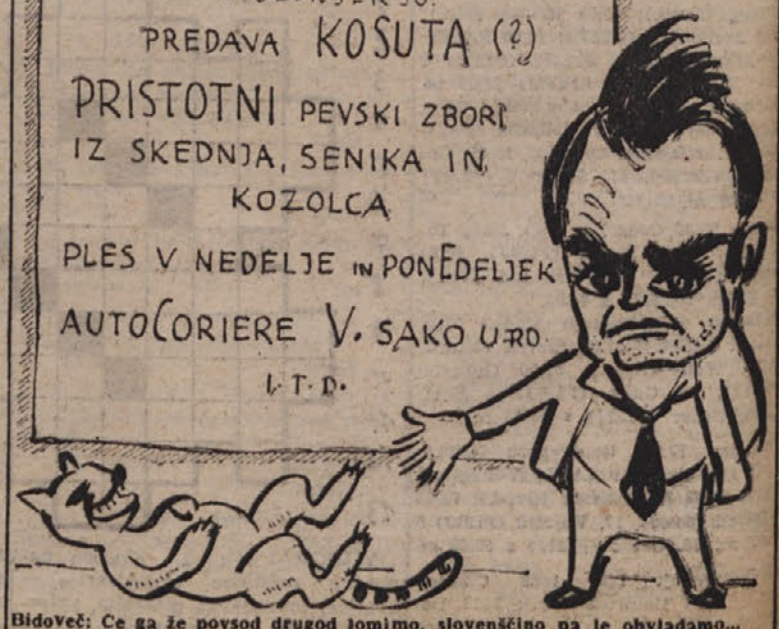
Bidovec: Če ga že povsod drugod lomimo, slovensčino pa le obvladamo...

OTVORITEV LJUDSKEGA DOMA V PODLONJERJU. PREDAVA KOSUTA (?) PRISTOTNI PEVSKI ZBORI IZ SKEDNJA, SENIKA IN KOZOLCA PLES V NEDELJE IN PONEDELJEK AUTOCORIERE V. SAKO URO L.T.D.