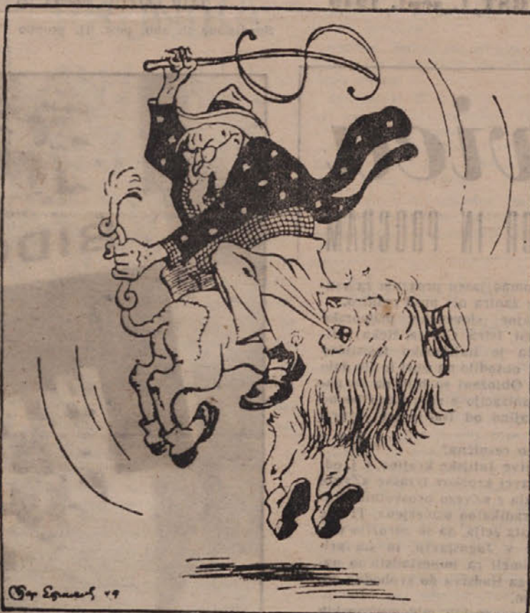
Angleški lev in njegov jezdec

Se bolj jasen pa je bil Truman, ki je v svojem govoru v Filadelfiji dejal, da ZDA ne mislijo dati nobene miloščine. Ta Trumanov govor je nadaljevanje njegovega govora v Miami, ki ga je imel prejšnji teden. V obeh govorih je Truman razvijal teorijo o ameriški zamisli rešitve ekonomske krize na tak način, da bi si zagotovil podporo Kongresa za svojo napačno politiko. Politični komentator moskovskega radia je dejal, da kljub temu, da propagirajo Trumanove načrte njegovi najtežji kalibri, kot so gen. Brandley, Marshall Acheson in Harimann, Kongres le ni hotel izglasovati njegovega programa za oborožitev. Ameriški napredni krogi odločno obsojajo Trumanovo politiko, ki še bolj pogloblja gospodarsko krizo in vodi do nevarnih mednarodnih avantur. Trumanovo politiko obsoja celo senator republikanske stranke Dulles, ki je dejal, da sedanja ameriška politika vodi po poti, ki vodi do vojne.