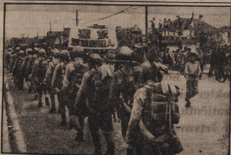
Oddelki demokratske vojske kofakajo skozi osvobojena mesta v Kaotou

Medtem pa se tudi v Pekingu vrše priprave za vzpostavitev nove kitajske demokratske vlade. V zvezi s tem je prispela iz Sanghaja v Peking vdova po ustanovitelju kitajske republike Sun yat Senu. Sprejel jo je sam Mao Tse Tung in poveljnik vojske Ču Teh. Vdova uživa v demokratski Kitajski velik ugled prav zaradi svojega zadržanja do nacionalistov, s katerimi nikoli ni hotela sodelovati, čeprav jo je Cangkajšek večkrat vabil. Poročajo, da bo nova kitajska vlada koalicijska vlada pod vodstvom komunistov.