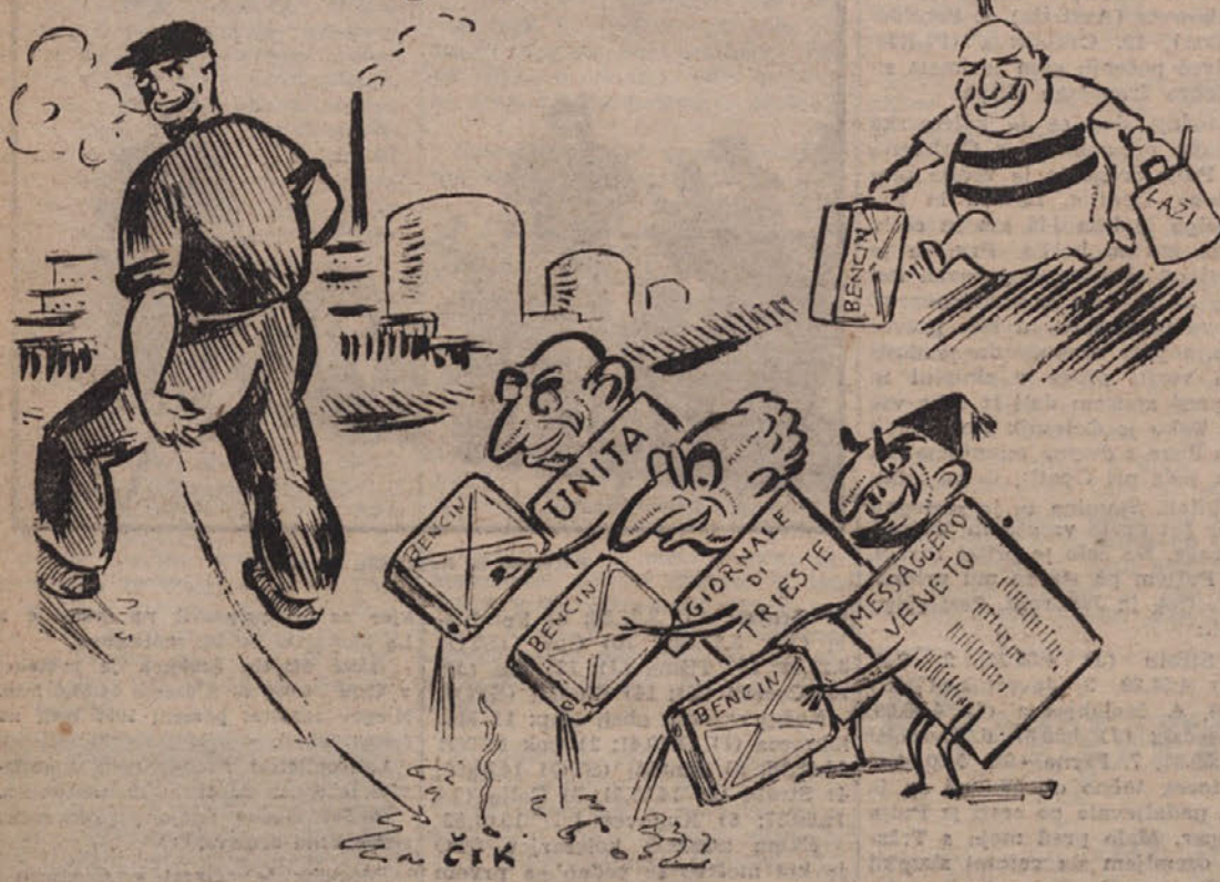
Tržaški reakcionarji in kominformisti so zanetili ogenj v ratinerji natte na Reki. Unità pa je še pritišla svojo dozo laži in bencina, da bi gorelo vsaj na papirju, če že n Reki ni hotelo tako kot bi si oni želeli.