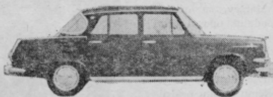
ŠKODA 1000 MB

za vse vlagatelje vezanih dinarskih in deviznih sredstev, Nagrade: dva osebna avtomobila in še 108 nagrad.