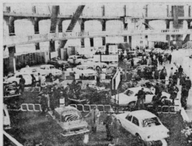
Pogled na razstavišče

Karoserija 1000 MB Deluxe je pregledna, lepe oblike, ima 4 vrata, 5 sedežev, notranjost je za ta denar solidno opremljena. Volan je neposreden, omogoča okretno vožnjo. Prestavno ročico ima na tleh. Dimenzije vozila so skladne, dolžina 417 cm, širina 162 cm in višina 139 cm. Prazno vo-