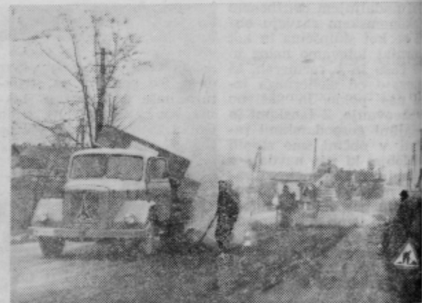
Krpanje asfalta je neuspešno, ker ni prave podlage

Na makadamske ceste smo navozili še gramoza. Zanje ni namenjenega denarja, tudi gramoza ne več kot prejšnja leta. Letos bomo poskušali kopati ja strojno. Premalo število starjev tega dela ne zm