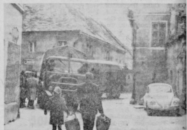
Tovornjaka s prikolico dalj časa niso mogli spraviti iz ozke ulice

sa. Med gledalci je bilo tudi čuti da je zadnji čas da se čuti, da je zadnji čas, da se