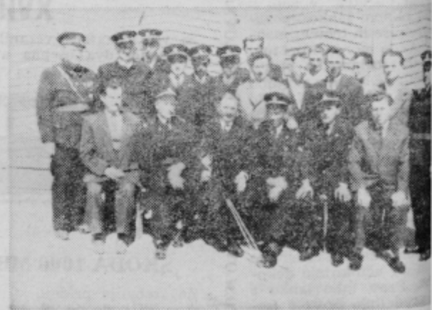
Gasilci iz Lovrenca ob 75 letnici ustanovitve društva

materiala in kar je bilo najbolj žalostno, štiriletno deklico in staro ženo. Glede na to so lovrenški možje 1886 ustanovili gasilsko društvo. Postavili so lesen dom, nabavili ročno brizgalko na dveh kolesih, h kateri so morali donositi vodo v vedrih. Skromna oprema ni mogla preprečiti številnih požarov, ki so sledili. 1887 je v Pleterjih pogorelo 15 hiš, 1888 v Apačah 3 hiše, 1903 v Zu-