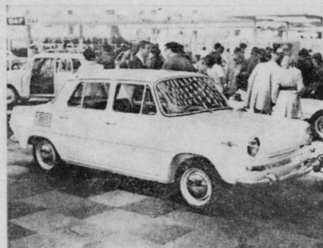
ŠKODA 1000 MB DE LUXE

renco pobija z zelo nizkimi cenami, razliko pa pridobi s prodajo rezervnih delov, ki so sorazmerno dosti dražji. Ni čudno, če so škode na evropskem tržišču vsakdanjost. Jugoslovanski kupci so za tovarno zanimivi, saj jih privlačita nizka cena in ugodni pogoji nakupa. Tovarna izdeluje tudi druge modele, kot so: škoda 1100 MB Deluxe, 1000 MB standard, 1000 MBT, oktavijski combi in pa 1202 STW. V Beogradu je tovarna prikazala MB 1000 reli, ki doseže 170 km na uro in pa škodo