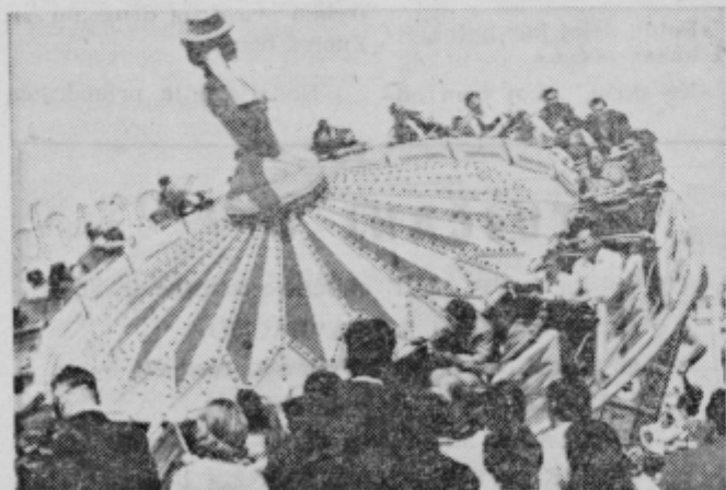
Na Graškem sejmu je bil dobro obiskan tudi zabavni park, kjer je bil tudi ta vrtljak

zgradi sodobno in za potrebe stavniki vseh treh ptujskih trgovskih podjetij z namenom, da bi se pogovorili sodelovanju ali celo o združitvi in da bi bili skupaj bolj »močni«. Kot kaže, razgovori niso rodili sadov. Pri katerem poskusu uspelo šoferju spraviti kamion iz ulice ne vem, ker sem moral oditi. Naslednji dan so mi pripovedovali, da morali odpeti tovornjak prikolice, ga pripeti zadaj tako izvleči prikolico iz ozke ulice. ZR