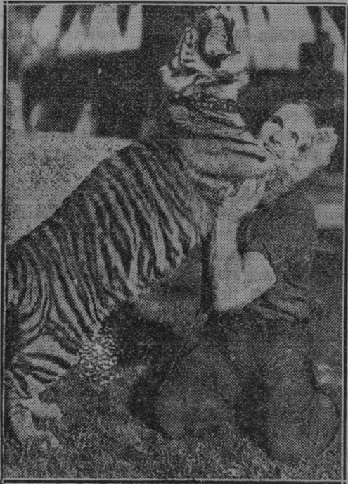
Enoletni tiger »satan« v kaliforniškem živalskem vrtu.

plozije pokvarila vse telefonske zveze po premogovniku in električne napeljave.