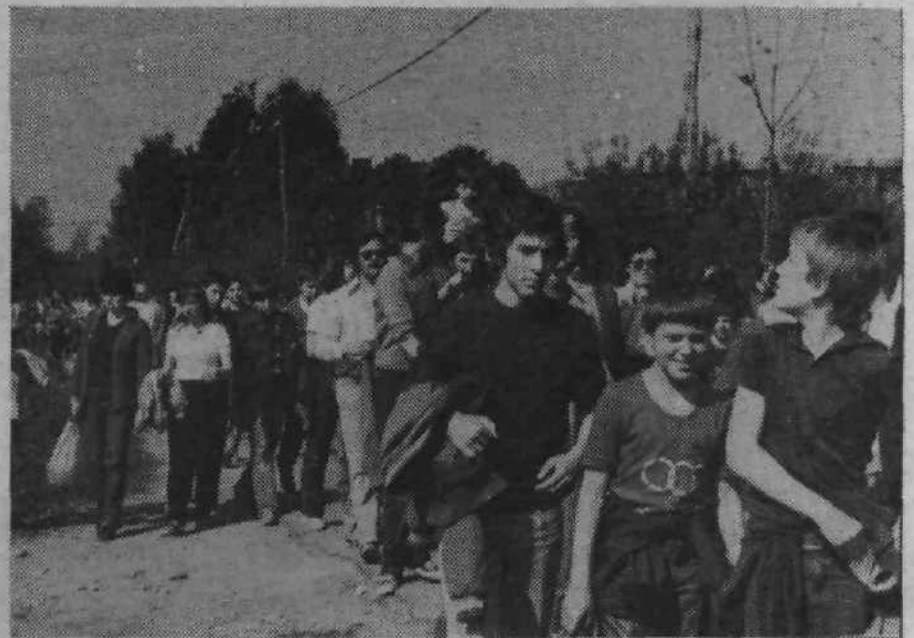
Ob 8. uri zjutraj je oživel start na Vrhovcih, prepolni avtobusi so tjakaj vozili udeležence pohoda na 8 kilometrov dolgi progi. Kolona pohodnikov je že v nekaj minutah postala strnjena, množice so se po poti spominov in tovarištva odpravile proti Kosezan.