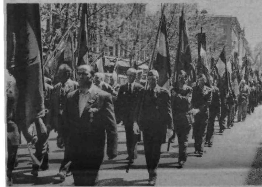
Cilj je bil na Trgu revolucije, kjer so organizatorji poskrbeli za čaj, godbeniki za dobro razpoloženje, slavnostni zaključek pa se je pričel s prihodom borcev enot, ki so osvobodile Ljubljano, borcev domicilnih enot, medvojnih aktivistov OF; prelep je bil pogled na številne prapore.

Iz Fužin in iz Vrhovcev so se v prelepem sobotnem dopoldnevu pričele viti kolone delovnih ljudi in