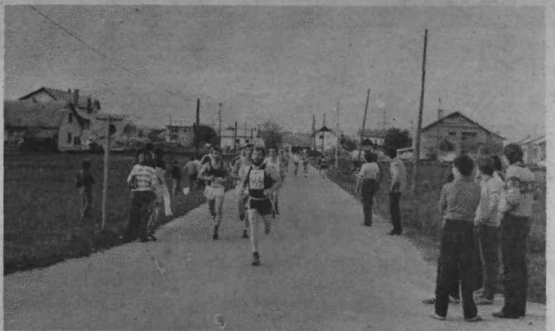
Osemindvajset kilometrov ni malo, vsi tekmovalci so na progi izgorevali do poslednjih moči. Kolona se je kmalu po startu razmaknila, pred prvim vzponom na Urh in pozneje Orle je bila razlika med vodečimi in zadnjo ekipo že izredno velika, pa vendar, to ni bilo važno: zmagovalec partizanskega marša je bil vsakdo, ki je prišel na cilj.