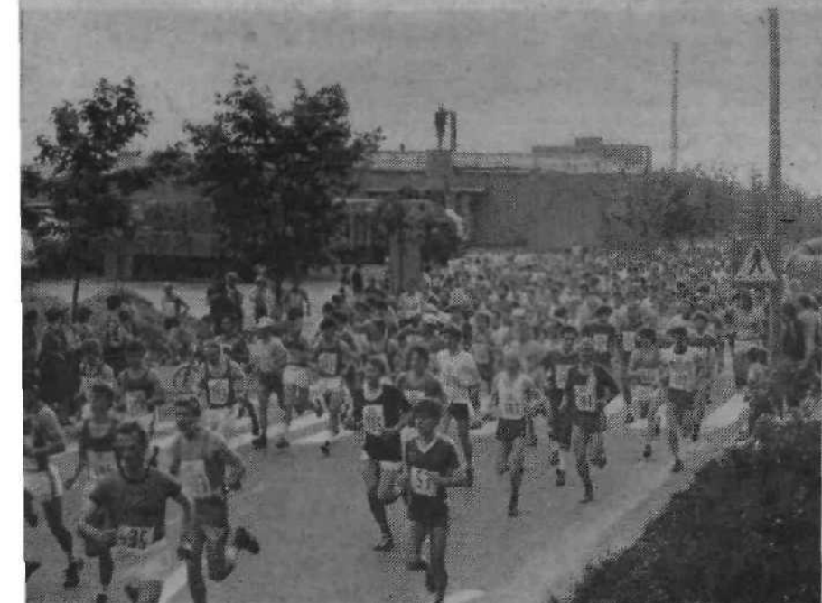
Med popoldanskimi prireditvami pa velja nameniti nekaj besed najnapornejši - partizanskemu maršu moških na 28 in ženskih ekip na 8 kilometrov dolgi progi. Letošnja udeležba je bila rekordna, start moških ekip na Allendejevi ulici za Bežigradom pa je bil privlačen tudi za številne gledalce.