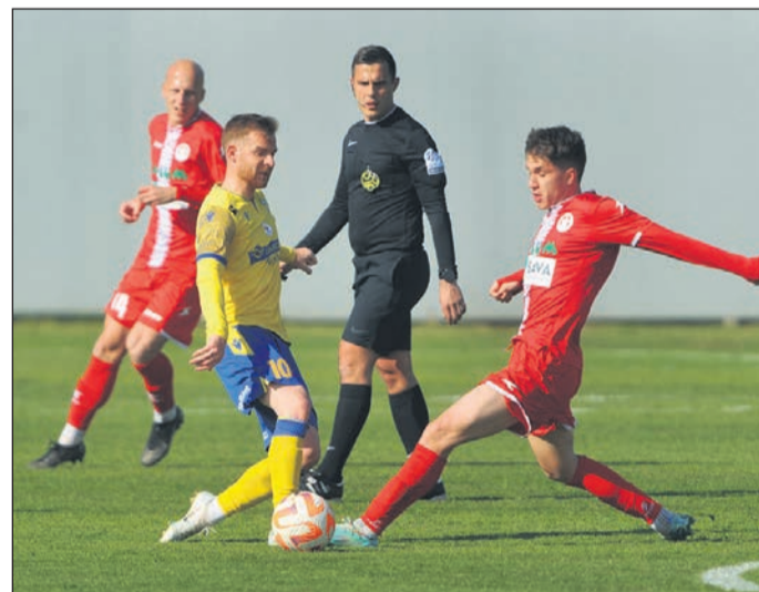
Nogometaši Aluminija so v letošnji sezoni Pokala Pivovarna Union ugnali Koper in s tem dokazali, da prvoligaši zanje niso nepremagljivi.