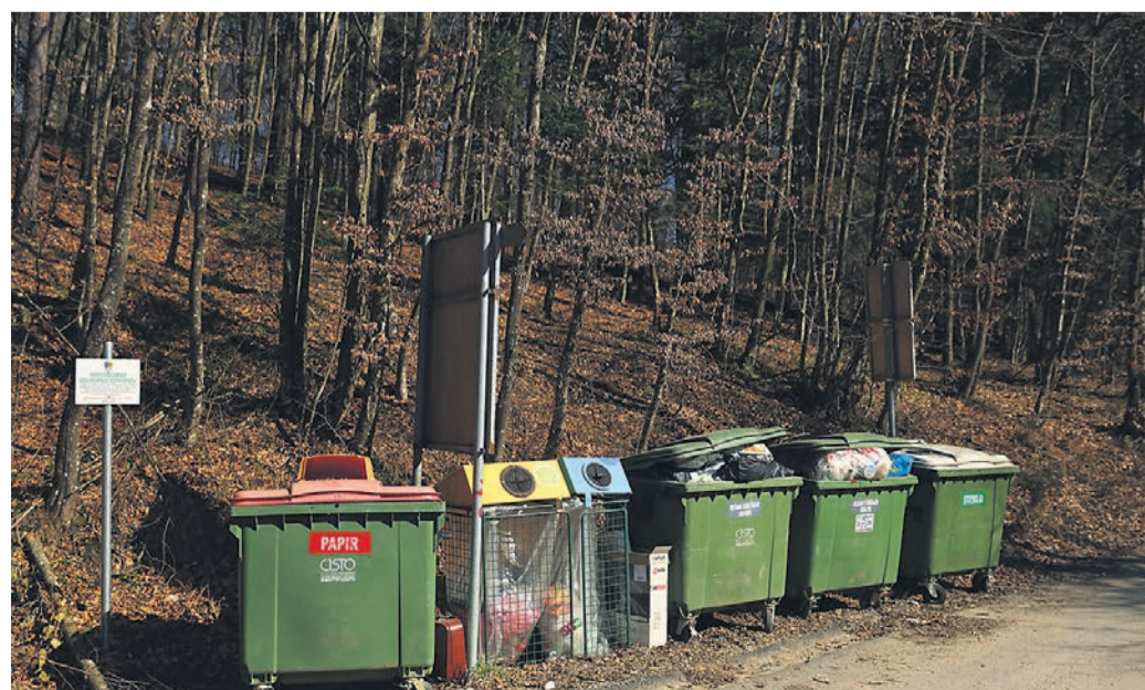
Čisto mesto Ptuj skrbi za odvoz odpadkov v vseh šestih haloških občinah. Največ odpadkov na prebivalca (brez zbirnega centra) podjetje odpelje iz Vidma.