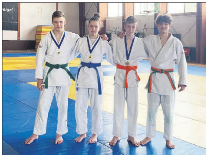
Judo: arhiv Judo kluba Drava Ptuj