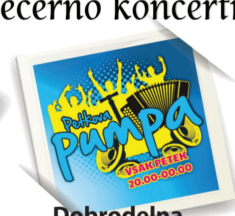
Dobrodelna Petkova pumpa