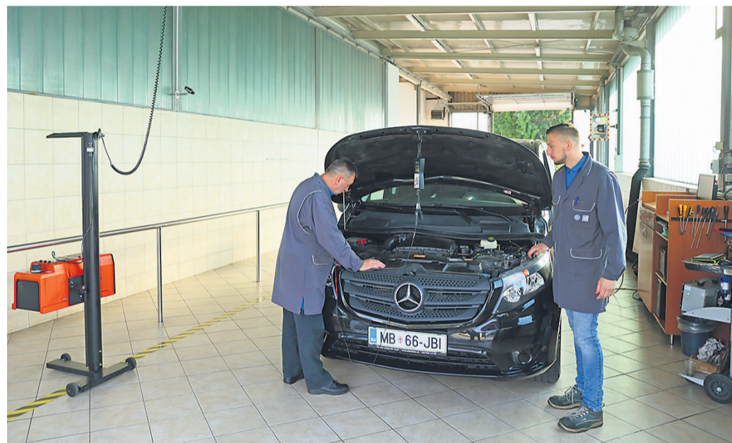
Ekipa tehničnih pregledov med delom

Dominkovi imajo dve podjetji: Dominko in Dominko center, ki