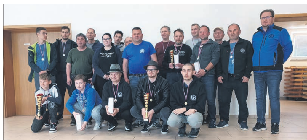
Dobitniki pokalov in priznanj v ekipnih in posamičnih konkurencah