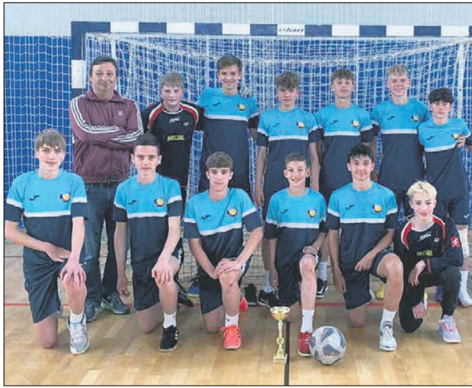
Nogometna ekipa OŠ Ljudski vrt s podružnico Grajena je drugo leto zapored osvojila 3. mesto.