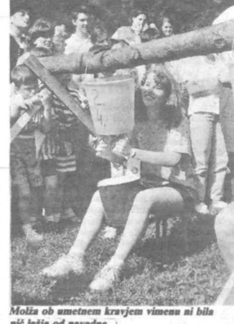
Molza ob umetnem kravjem vimezu ni bila nič lažja od navadne