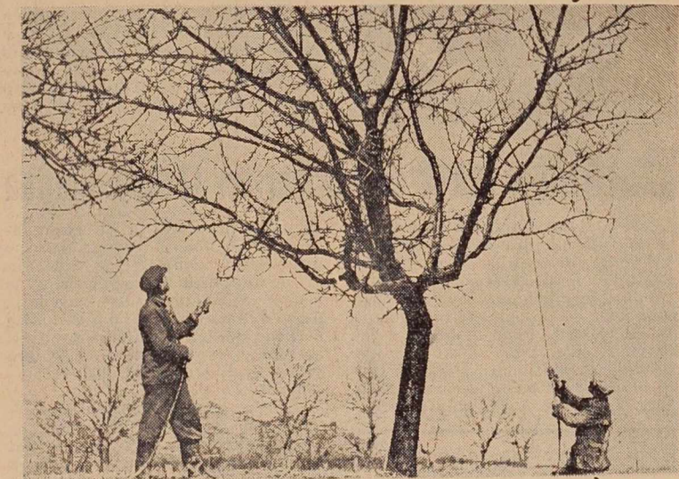
Kdor redno in temeljito škropi sadno drevje, ta v jeseni obira bogate plodove. Skropljenje je posel št. 1 v naših sadovnjakih. Da bi se tega zavedali prav vsi sadjarji!

imenujemo rudninske snovi. Kalij, kalcij, natrij, dušik in kisik vsrkavajo korenine s svojimi laski v obliki kalijskega, kalcijevega ali natrijevega solitra kot solitrno vodno raztopino. Važno je, kako nastajajo te hranilne snovi v zemlji. Iz