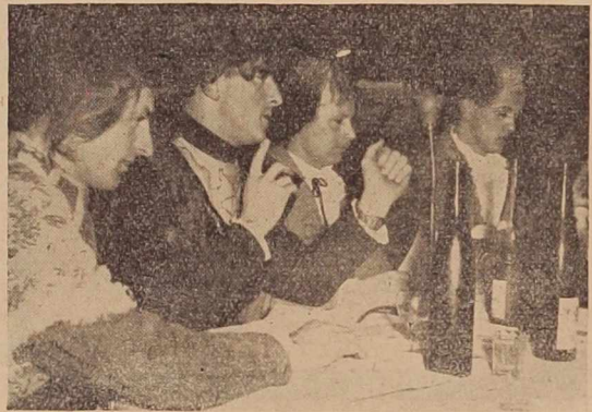
Z brucovanja: »Veliki« može pri »važnem« opravilu