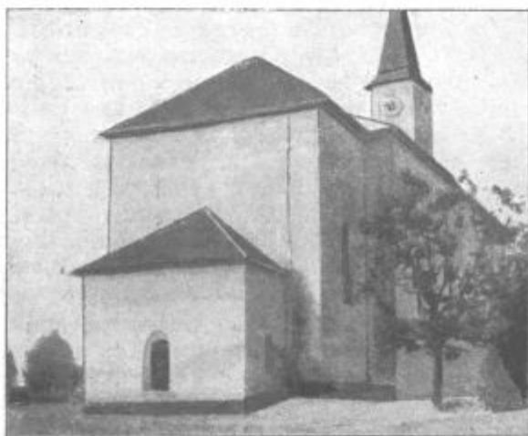
Crensovška cerkev odzvuñaj, v šteroj se vrši sveti misijon od 17. do 24. novembra

Pri vzgoji dece pa skrbno premisliti i povedati, če se hči ali sin ne tepete po noči okoli, če prilik na greh ne obiskavleta i če njima data stariša dober zgled. Pri vsakom smrtnom grehi moram povedati, kelikokrat sem ga včino. Če si nikak ne morem prehoditi kelikokrat sem včino smrten greh, povem približno kelikokrat. Na priliko letno, mesečno, tjedensko itd. teliko i telikokrat.