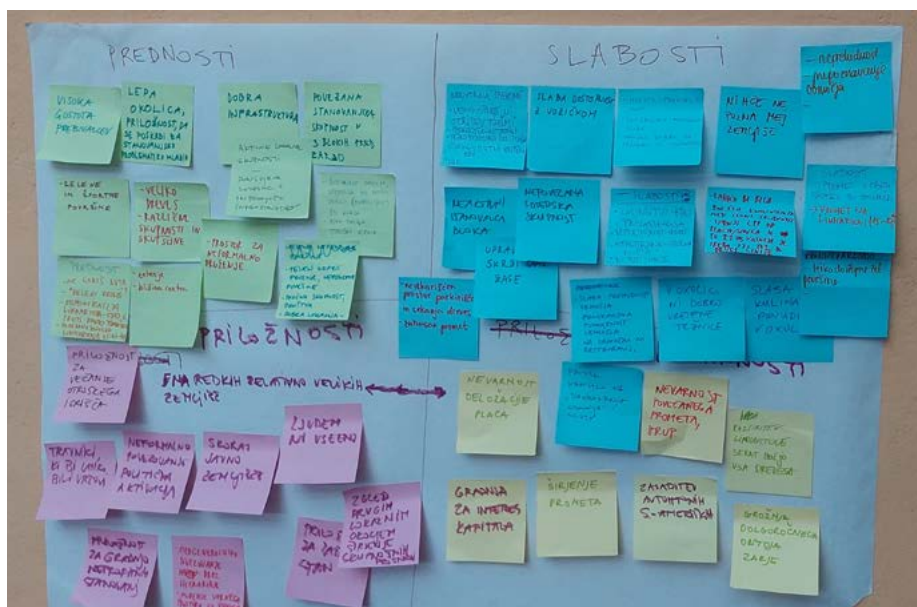
Slika 2: Plakat z artikulacijo prednosti, slabosti, priložnosti in nevarnosti, kot so jih identificirali udeleženci delavnice »Kaj bomo s Stolpniško?«, 15. 6. 2023.