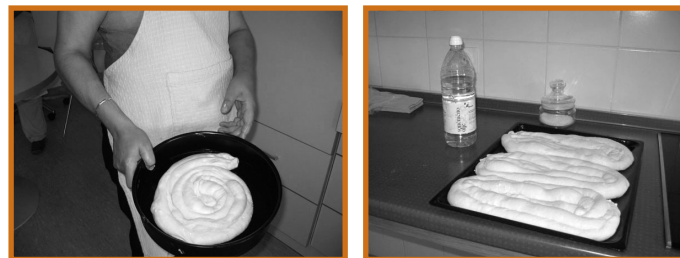
Slika 1: Dejavnost v delovni terapiji

»Rada kuham ... kadar kuham, pozabim na svoje težave ... uporabljam roko, ki mi ne služi najbolje ... tudi to je terapija ... Pa še rada jem hrano, ki jo sama pripravim ... doma se že veselijo moje vrnitve domov.« (slika 1)