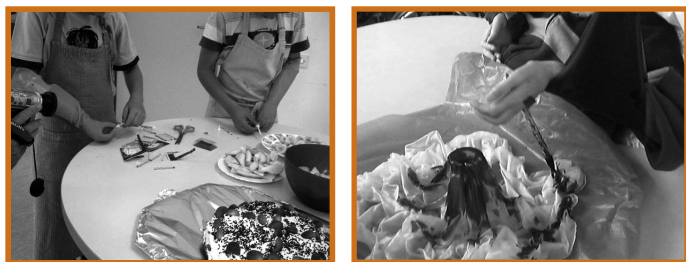
Slika 3: Dejavnost v delovni terapiji

»Pojem dejavnost pomeni osnovo za delovno terapevtsko obravnavo – hkrati nas obvezuje, da ga razumemo v vseh razsežnostih« (slika 3)