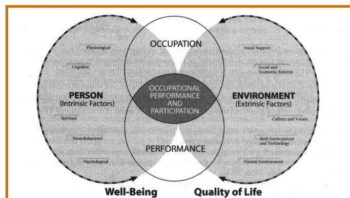
Slika 2: Kompleksnost dejavnosti (11)

Okupacijska znanost je usmerjena v razumevanje človekove narave, pogojev in dejavnikov, ki vzpodbujajo in vplivajo na izvedbo življenjskih aktivnosti (4). Okupacijska znanost bo podprla osnovno filozofijo stroke, omogočila nova spoznanja fenomena dejavnosti in nadgradila obstoječe programe v praksi. Z dokazi podprta praksa se bo odražala v posameznikovem aktivnem sodelovanju na vseh področjih človekovega delovanja. Kakovost življenja in dobro počutje bosta v tesni soodvisnosti od posameznikove dejavnosti (slika 2).