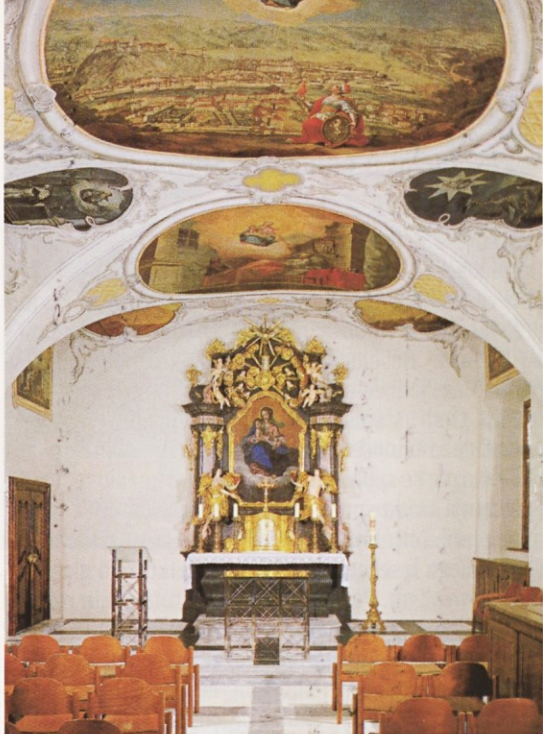
Slovenska kapela v Gradcu

rake zadnje čase podvzeli Španija in Italija v posebnem primeru naseljencev in njihovih potomcev v Argentini.