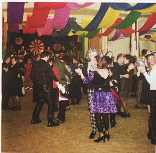
Pustovanje 2002 – plesati in plesati