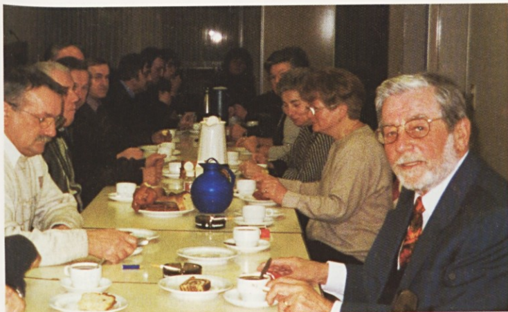
(Castrop) Prijetno srečanje po sveti maši