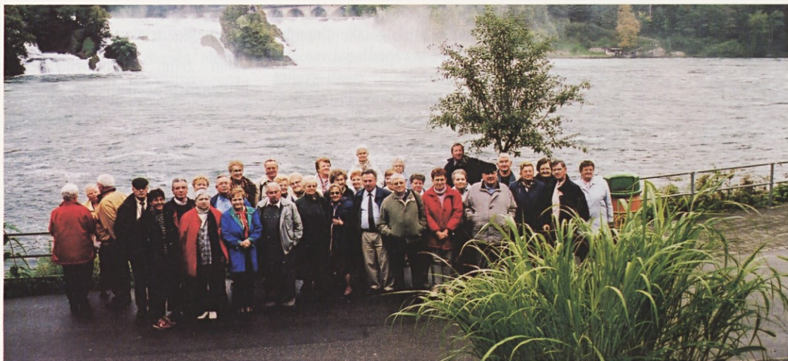
Romarji iz Merlebacha pred slapovi Rena