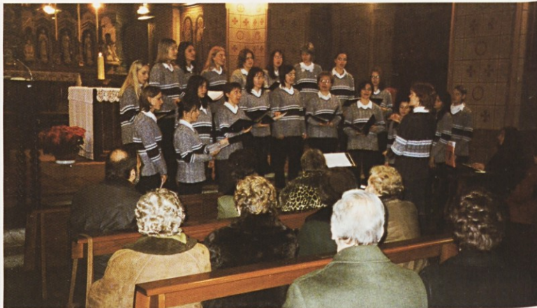
(Milano) Zbor Znamenje iz Voljč med rojaki

Spomnil se je na veliko noč. Sredi aprila je bila in češnje ob hiši so že cvetele. Šel je k vstajenju kakor vsako leto, toda potem, ko je stopil po maši iz cerkve, se mu je kar naenkrat zazdelo, kakor da ni poslušal aleluje, temveč je vsenaokoli jesen in je praznik vseh svetih in bodo jutri verne duše. Kakor v nekih sanjah je šel na pokopališče in se čudil, ker ni bilo po grobovih skoraj nobenih sveč - le tu in tam kakšna. Ja, on pa jo je imel s seboj. Prižgal jo je in jo postavil na Jeričin grob. In potem, ko so se popoldne pripeljali Minka in njen mož ter sestra Ivanka, jim ni vedel