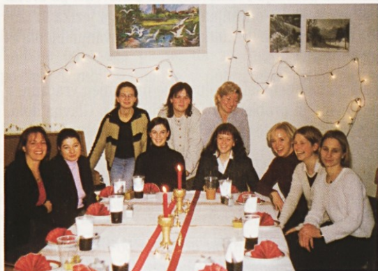
Dekliški pevski zbor iz Münchna

Vemo, da se je prav primer Hrvaške žalostno izjalovil, medtem ko je v tem času zaradi posebnih okoliščin Izrael še ojačil vseljevalno politiko in sta konkretne ko-