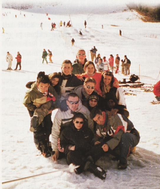
Mladi Slovenci iz Francije na smučanju pod Poncami