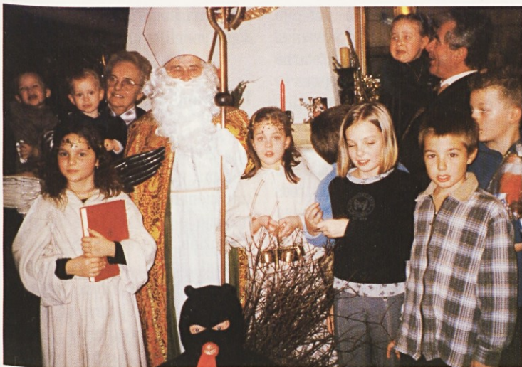
Miklavževanje pri slovenski misiji v Framyng-Merlebachu (december 2001)

Društvo Prijateljev Slovenske katoliške misije želi lepo praznovanje velikonočnih praznikov vsem Slovencem doma in po svetu. Naj blagoslov Vstalega Kristusa podeli mir, srečo in veselje.