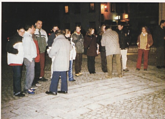
MLADI IZ PARIZA NA TRGU V KRANJSKI GORI

A problem “repatriacije” je mnogo večji. Slovenija mora načrtovati stvarno in dolgoročno vseljevalno politiko do po svetu živečih Slovencev in njihovih potomcev, ki naj bo del širše politike prebivalstva, katere smoter je dobrobit celotnega naroda in slovenske države. Ta politika se ne more omejiti le na reševanje neke