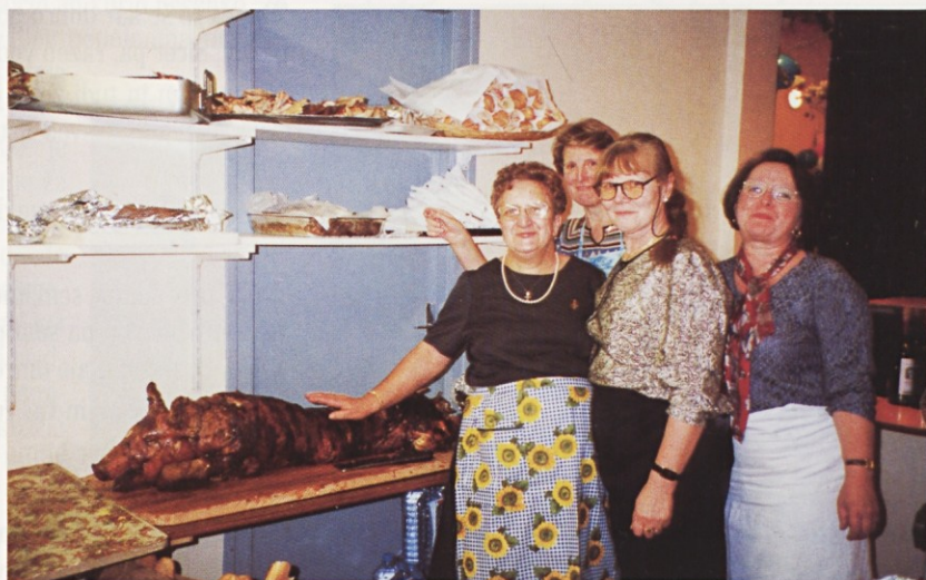
(Pariz) Naše pridne gospe v kuhinji ob 40. letnici društva Slovencev.

Saj je včasih tudi že pomislil, da bi mu jih pomagal pripraviti Minkin mož, danes pa se je tej zamisli lahko le nasmehnil. Le kako naj bi prekladal rajklje in polena