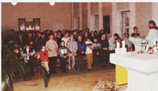
MLADE DRUŽINE Z OTROKI IZ STUTTGARTA IN AALENA SO UDELEŽILE SOBOTNEGA DNE NA BIBLIČNEM SEMINARJU.