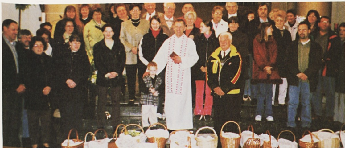
Del rojakov pri sv. Janezu na veliko soboto