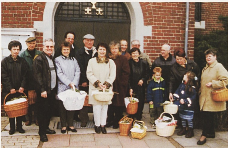
(Eschweiler) Blagoslov velikonočnih jedi

Vsak od njih je imel svojo veličino, svoje radosti in težave. Različna pota so jih pripeljala na tuje z upanjem na boljši jutri, za katerega so se trudili in prišli do zadnje zemeljske postaje tu na tujem, kjer bodo njih telesa čakala novega povelja po Kristusovi zmagi v velikonočnem jutru. Kot rojake jih priporočam v molitev. Naj se spočijejo v Bogu od zemeljskega truda.