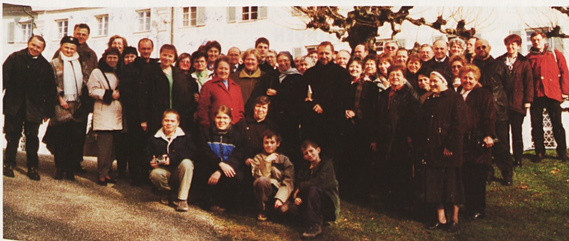
Skupina vernikov iz Stuttgarta in okolice na koncu bibličnega seminarja v Ellwangu.