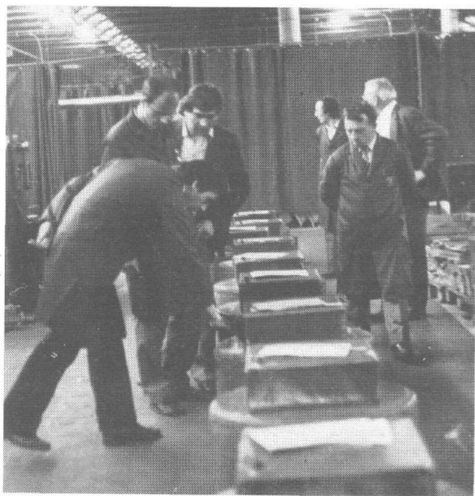
Strokovna komisija je tehtno ocenjevala delo varilcev

Prvega tekmovanja kovinarjev so se udeležili delavci iz naslednjih delovnih sredin: Ilirija-Vedrog, Plutal, SGP Grosuplje tozd Strojni park, Iskra tozd PMD, Slovenijales - Žičnica, Kovinska industrija Ig, Iskra Horjul, Avtomontaža tozd Utensilia, IGO in SZ Tovil