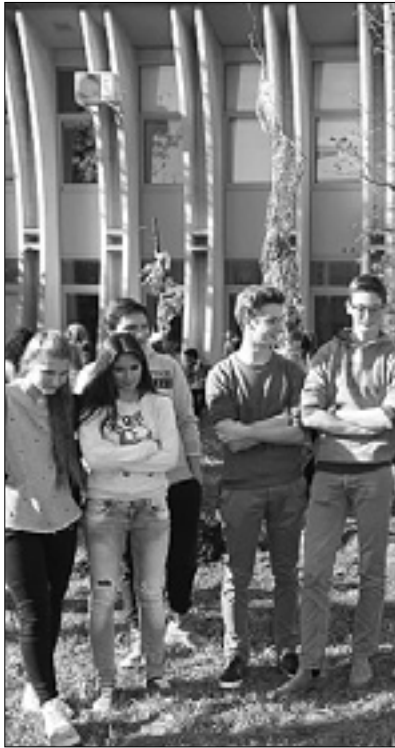
Slovenski višješolci v Gorici BUMBACA

V prihodnjem šolskem letu bo prve razrede slovenskih višjih srednjih šol v Gorici obiskovalo približno enako število dijakov kot letos. 30 nižješolcev je izbralo smeri, ki jih ponuja tehniško-poklicni pol, 35 pa klasični, humanistični ali znanstveni licej. Čeprav bo število »novincev« ostalo bolj ali manj nespremenjeno, bo število dijakov obeh polov v primerjavi z letošnjim letom naraslo: skupno bo višješolski center v Puccinijevi ulici štel 275 dijakov namesto sedanjih 256. Delež tretješolcev slovenskih nižjih srednjih šol Trinko in Doberdob, ki so se odločili za italijansko višjo srednjo šolo, je približno 30-odstoten: »osip« ostaja torej precejšen, a je bistveno nižji od lanskega. Pred enim letom se je namreč za nadaljevanje študija na italijanski višji srednji šoli odločilo približno 39% tretješolcev, ki so obiskovali slovenski nižji srednji šoli na Goriškem.