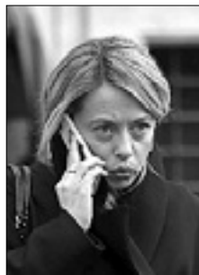
GIORGIA MELONI