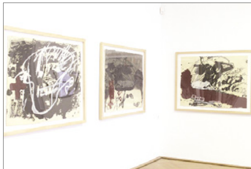
Razstava Antoni Tàpies, Grafika, 1959-1987