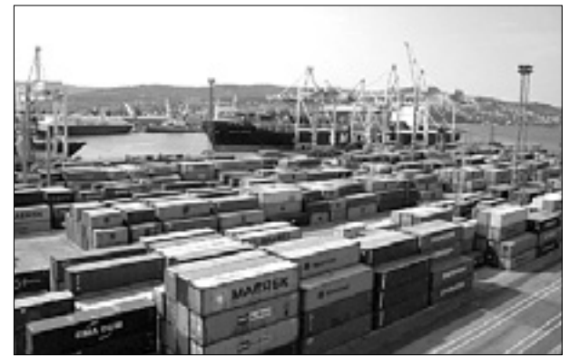
Pogled na koprski kontejnerski terminal

V mestnem javnem linijskem prevozu je bilo v januarju z avtobusi prepeljanih 4,3 milijona potnikov, kar je odstotek manj kot januarja lani. V Sloveniji je bilo po podatkih statističnega urada januarja registriranih 7679 osebnih avtomobilov, od tega 5944 novih, kar je 643 več kot v januarju lani. (sta)