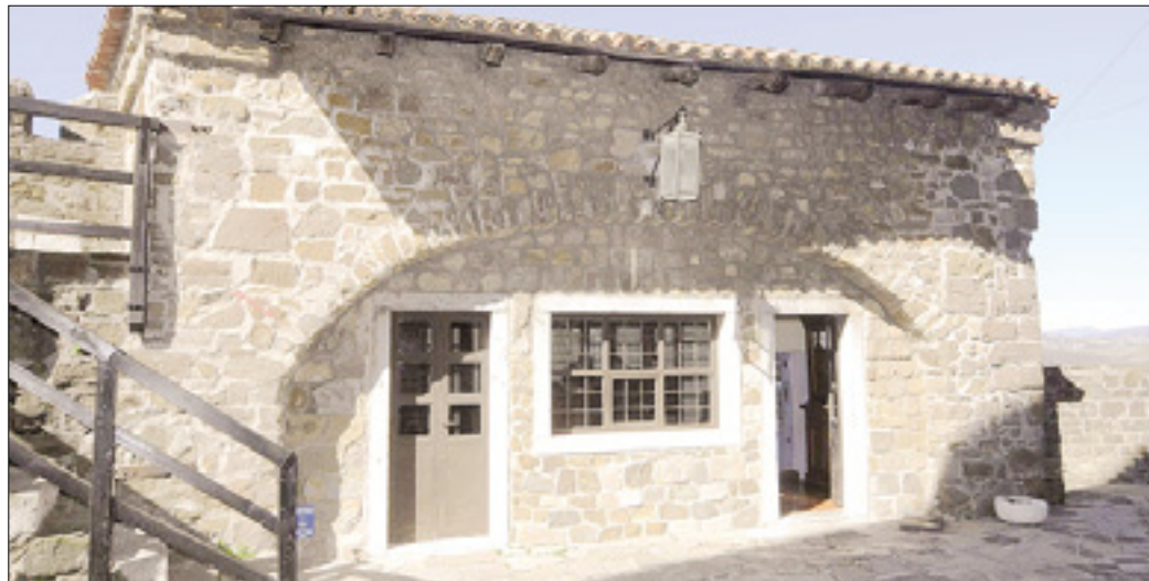
Bodoča okrepčevalnica (zgoraj) in grajski park (desno)

Uredili ga bodo tako, da bo ponovno privabljal družine z otroki, pa tudi športnike, rekreativce in vse, ki so radi na prostem. Goriška občina je objavila razpis za izbiro načrtovalca, ki bo izdelal projekt obnove in preureditve parka pod goriškim gradom. Gozdnoto območje med Ulico Giustiniani in grajskim obzidjem radi obiskujejo zlasti ljubitelji narave in športnih dejavnosti, ki pogosto naletijo tudi na kakšno veverico, srno ali drugo divjo žival: gre namreč za pravo zeleno oazo, ki pa je že več let precej zanemarjena.