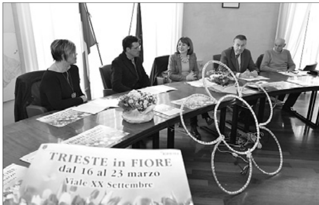
Drevored XX. septembra bo okrašen z lučmi v obliki cvetic

Na razstavi cvetja bo več kot 50 razstavljalcev, na programu tudi tekmovanje za najlepši cvetlični aranžma