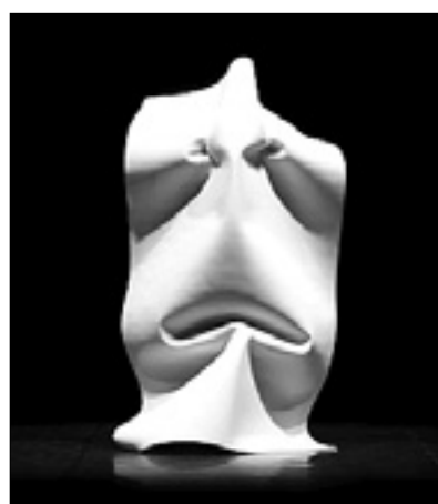
Telesa-predmeti, izrazno sredstvo skupine Mummenschanz