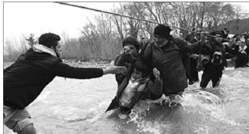
Veganje v prečkanju reke je bilo zaman: Makedonija jih je poslala nazaj ANSA

Po ocenah Evropske komisije je v Grčiji že 45.000 migrantov, od tega 12.000 v Idomeniju. Na grških otokih na prevoz na celino čaka že več kot 9000 migrantov, 2000 več kot v nedeljo, kar kaže, da se tok ljudi iz Turčije ne ustavlja. Tudi atensko pristanišče Pirej je prenapolnjeno, saj se je tam nabralo že okoli 4000 ljudi.