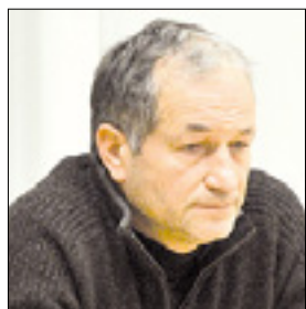
Aleš Debeljak

LEIPZIG - Od jutri do nedelje bo v Leipzigu potekal mednarodni knjižni sejem, eno najpomembnejših predpomladnih srečanj založnikov in knjigotržcev na nemškem in evropskem knjižnem trgu. Na slovenski nacionalni stojnici se bo predstavilo okoli 20 založb, posebej bodo izpostavljena dela pred nedavnim preminulega literata in sociologa Aleša Debeljaka. Kot so sporočili z Javne agencije za knjigo (JAK), bo na nacionalni stojnici predstavljena najnovejša produkcija slovenskih avtorjev po izboru založnikov ter slovenska in prevedena dela izbranih avtorjev. Za predstavitev so založniki lahko dostavili tudi svoje tujejezične kataloge in druga promocijska gradiva.