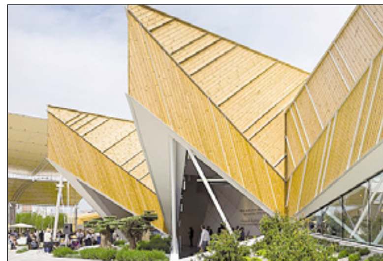
Slovenski paviljon na Expu