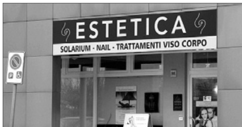
Okradeni lepotni center v Tržiču

ga izbrale za tarčo, običajno vstopale v paru in v elegantnih oblačilih. Tatice sta najprej nagovorili upraviteljico centra, ji povedali, da želita podariti prijateljici lepotni tretma, in sta zato drezali vanjo z vprašanji. Napovedali sta še, da se jima bo prijateljica pridružila v kratkem. Sogovornico sta vsakič zmedli do takšne mere, da jima je uspelo pobrati denar iz blagajne in iz torbic, puščenih na pultu, ter pobegniti iz centra. V Tržiču in Ronkah jima je uspelo ukrasti iz blagajne 300 evrov pa še 20 evrov iz torbice uslužbenke, nakar sta odšli iz centra z opravičilom, da gresta poiskat prijateljico, ki ji je bil dar namenjen.