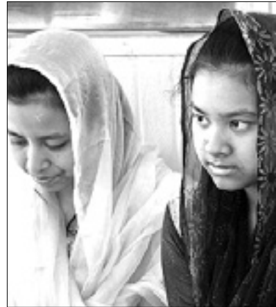
Muslimanski dekleti v Tržiču BONAVENTURA

S petnajstimi glasovi proti in s šestimi glasovi za je tržički občinski svet na svojem zadnjem zasedanju po dolgi in tudi vroči razpravi zavrnil predlog resolucije o prepovedi nošenja nikaba in burke. Nikaba je tančica, ki pri muslimanski ženski pokriva ves obraz razen oči, burka pa je enodelno oblačilo, ki telo pokriva od glave do tal in ima mrežasto odprtino, skozi katero ženska vidi, toda njena obraza ni mogoče prepoznati.