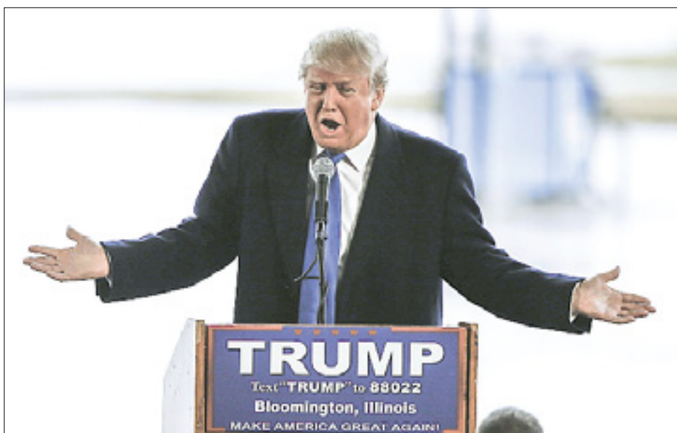
Trump preteklo nedeljo med kampanjo v Illinoisu

Potem je tu trditve, da Trump nikoli ne poravnava tožbe zunaj sodno, ker to vzpodbuja nove