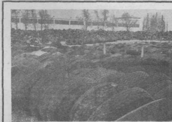
Že spomladi bo tale neugledna slika okolja Kemične tovarne Moste le še zgodovina. Odpadne gume, ki so jih doslej odlagali na tem mestu, so pričeli pošiljati v cementarno Anhovo, kjer jih bodo sežigali. Korist bo dvojna: lepše okolje, v cementarni pa bodo tako prihranili 10 do 15 odstotkov mazuta.