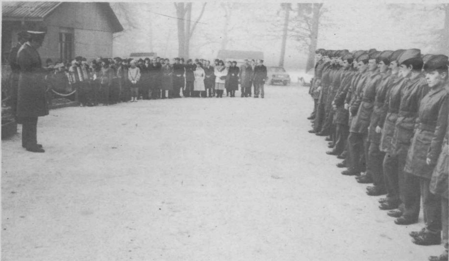
Slovesnost v vojašnici