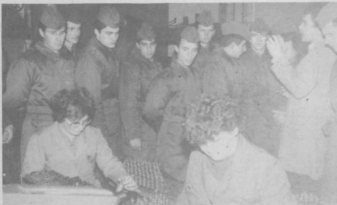
Ogled proizvodnje v tovarni Black & Decker

Mladi fantje, ki so na sluzenju vojaškega roka v grosupeljski vojašnici, imajo precej odgovorne naloge, tako da jim delovni čas hitro mine. Popoldan imajo možnost, da se ukvarjajo s športom (nogomet, odbojka, namizni tenis) ali pa igrajo šah ter — normalno — pišejo pisma. Sodelovanje z mladimi v Grosupljem je omejeno na kulturna in športna srečanja, ki pa se žal odvijajo le v času praznovanja 22. decembra. Razgovoru sta prisostvovala tudi kapetan Keravica in poročnik Vujović, ki sta glede na nekajetno poznavanje razmer ugotovila, da bi srečanja s »civilni« — mladimi iz Grosupljega — morala biti organizirana preko celega leta. Sami so pričeli z obiski vojakov v naših delovnih organizacijah. V »Black and Decker«-ju so bili npr. letos že drugi in ob ogledu proizvod-