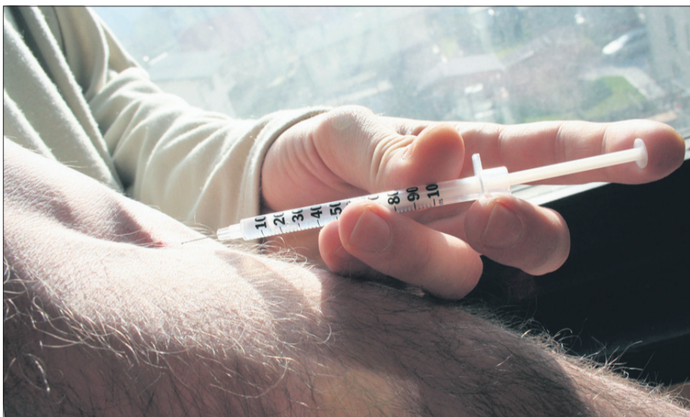
Starši morajo otroku z besedami in dejanji nazorno sporočiti, da je raba drog v družini prepovedana, je eno od sporočil, ki jih starši celjskih osnovnošolcev lahko slišijo na delavnicah o problemih odvisnosti.