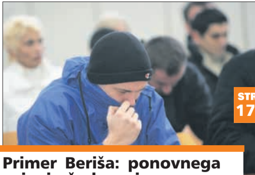
Primer Beriša: ponovnega sojenja še kar ni

RADIO CELJE 90,6 95,1 95,9 100,3 NOVI TEDNIK VSAK TOREK IN PETEK