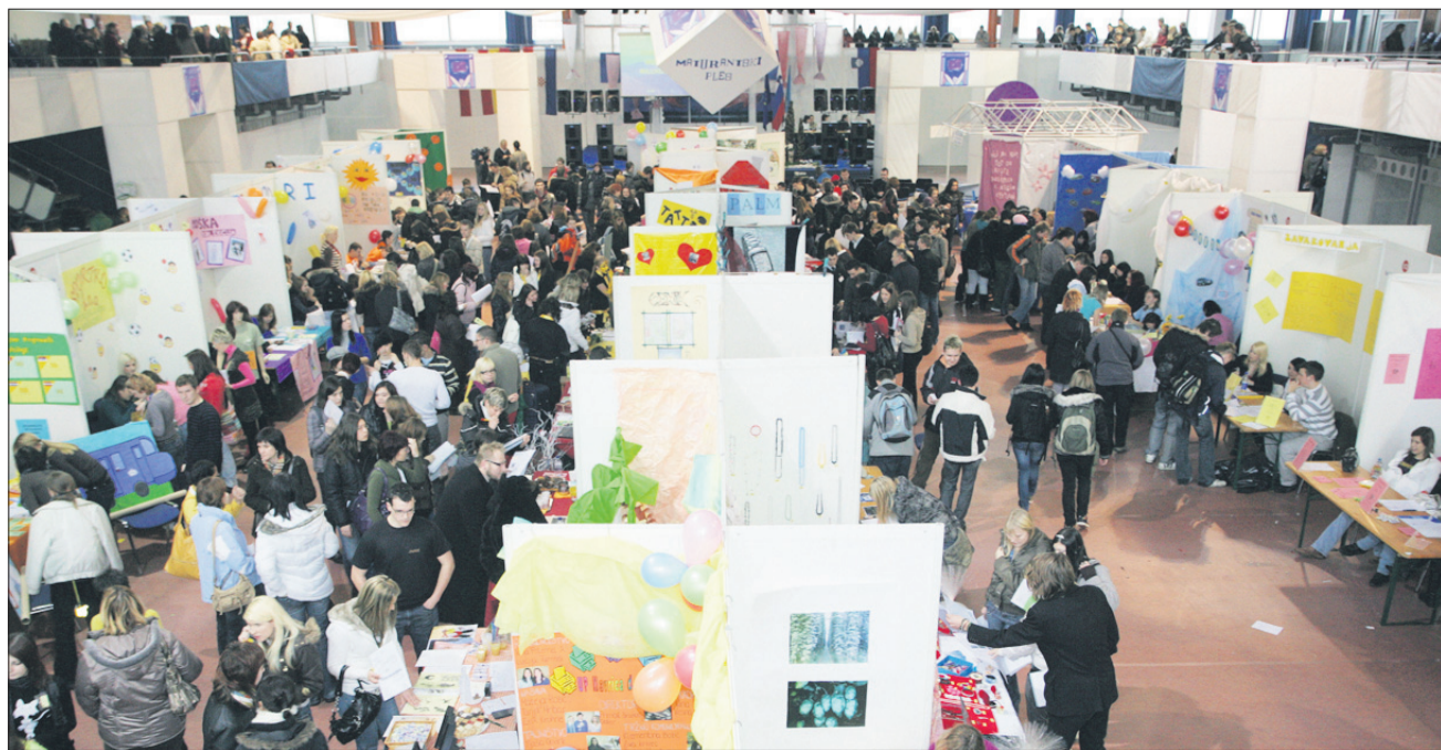
Na lanskem sejmu učnih podjetij je bila gneča precejšnja.