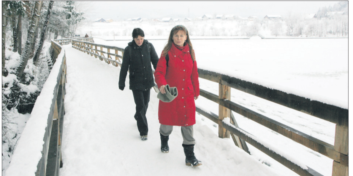
Sprehajalcev okoli Šmartinskega jezera ni manjkalo.