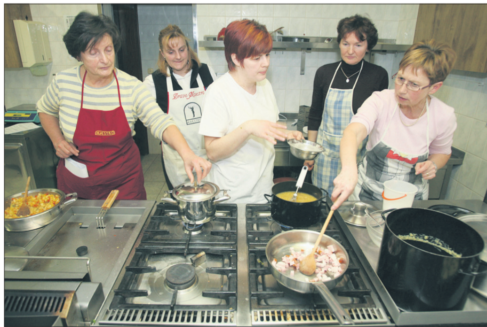
Nekaj »na žlico« sodi med obvezne jedi, ki se jih lotijo na večini kuharskih tečajev.