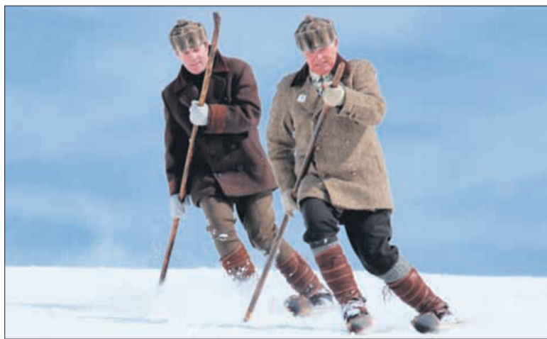
Prikaz telemark smučarske tehnike