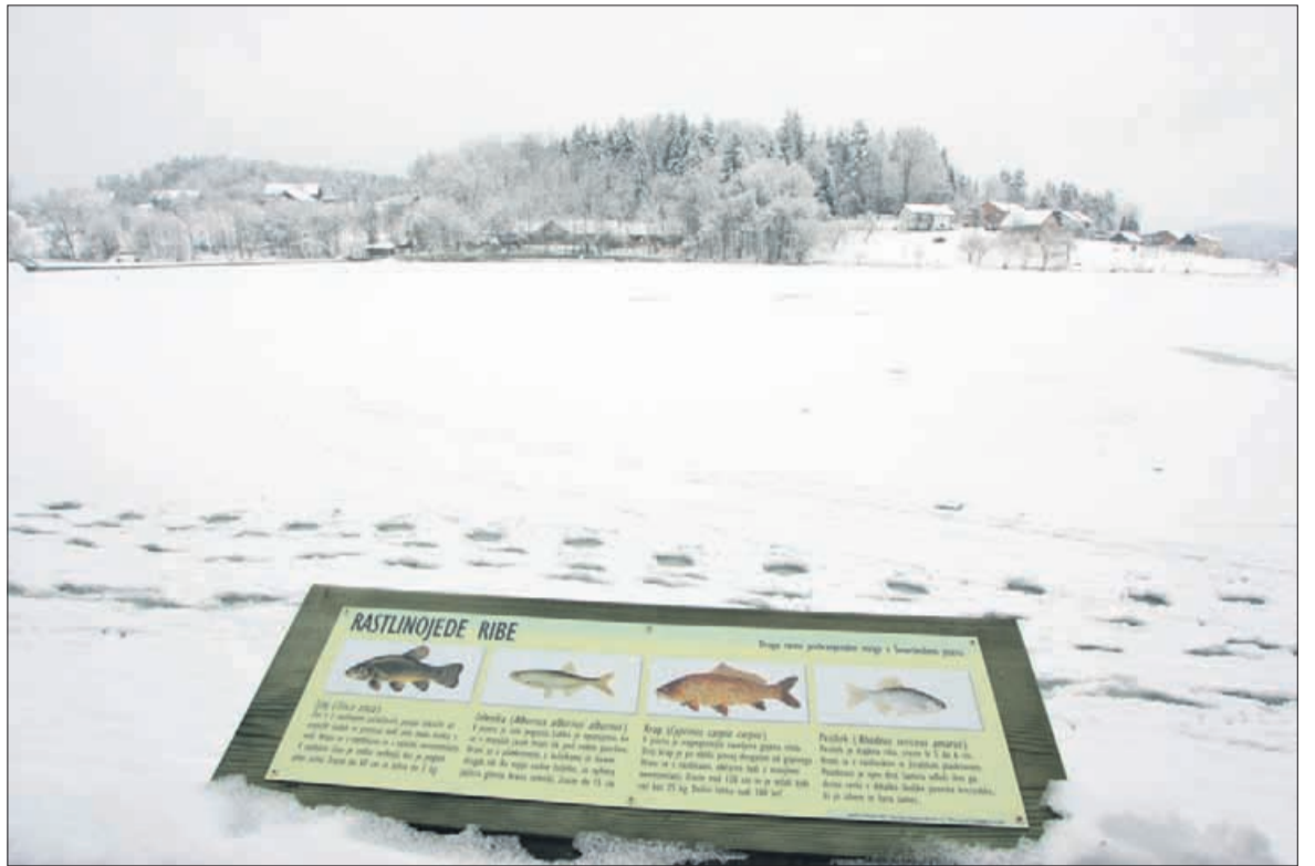
Sledi na zaledenem jezeru kažejo, da je bilo v preteklih dneh na njem že zelo živahno.