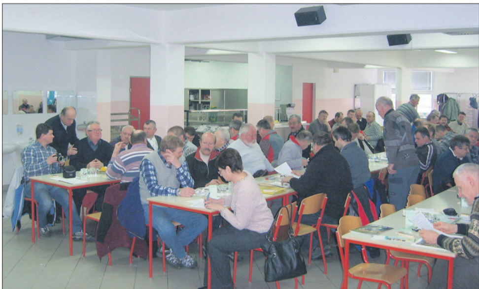
Srečanje markacistov v Vojniku

brezplačne, saj sta projekt sofinancirala Ministrstvo za šolstvo in šport in Srednja šola za storitvene dejavnosti Celje (ŠC Celje). Več o dejavnosti društva boste izvedeli na njihovi spletni strani: http://www2.arnes.si/~cesport/ SČ