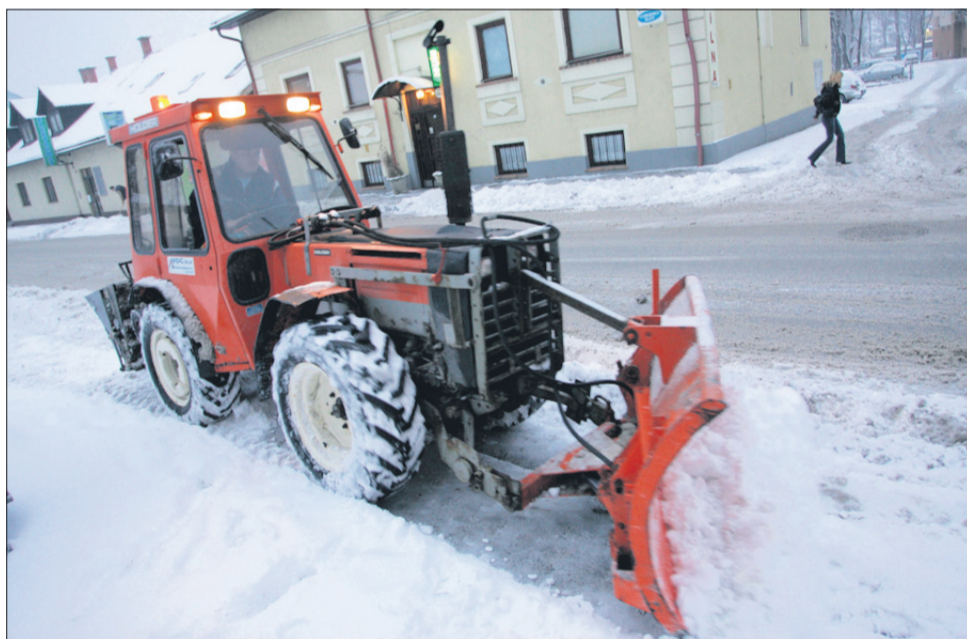
Šentjurčani imajo za zimsko službo predvidenih 400 tisoč evrov, vendar bo treba z rebalansom to številko povečati.