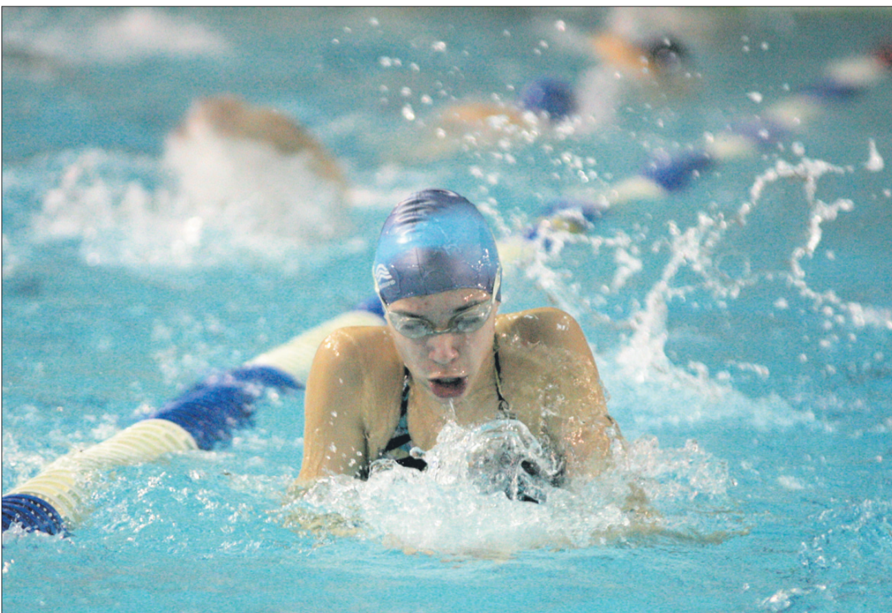
Zimsko prvenstvo Slovenije v Celju