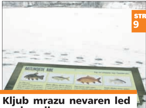
Kljub mrazu nevaren led na jezerih