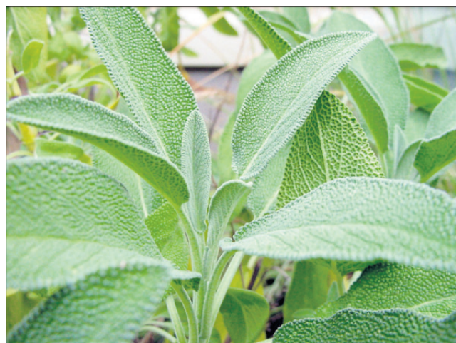
Pri uporabi žajblja je treba biti previden, ob predoziranju lahko pride do manjših ali večjih stranskih učinkov.