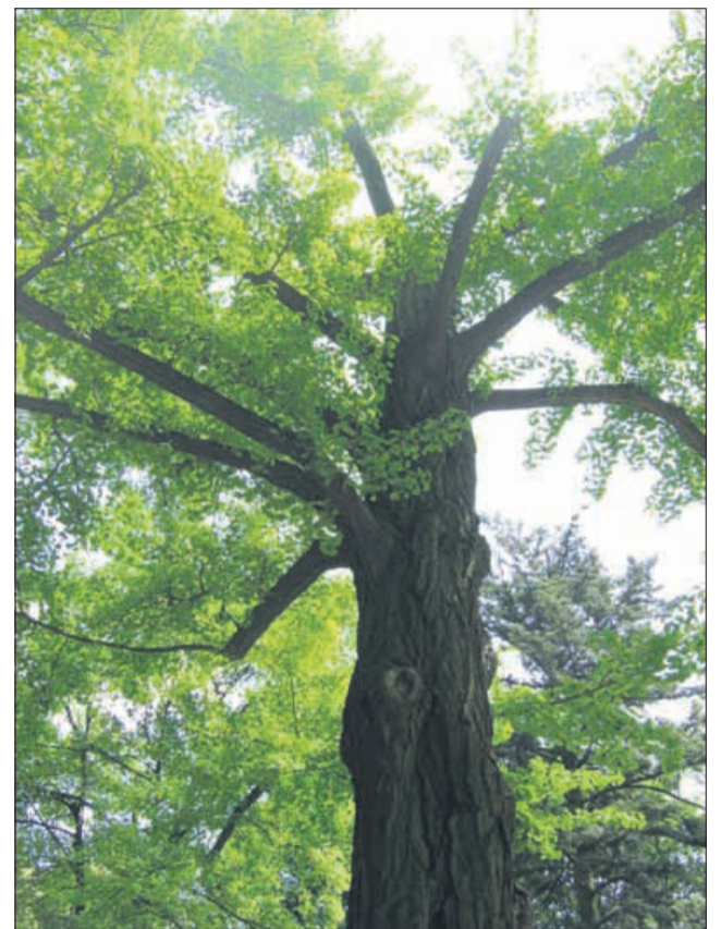
Eno najstarejših dreves na svetu je ginkgo biloba.

So pa druge raziskave potrdile ugoden učinek pri zdravljenju bolnikov s pešanjem spomina, zlasti pri Alzheimerjevi bolezni, kjer se izboljša spomin, sposobnost logičnega mišljenja, pomnjenje in učenje. Poveča se sposobnost opravljanja dnevnih opravil, socialni kontakti se ohranjajo na višji ravni, manj je tudi depresije. Zmanjša se poraba drugih zdravil, ki so potrebna za zdravljenje motenj v delovanju možganov, kar je zlasti izrazito pri družinskih oblikah demence. Deluje tudi zaščitno pri okvari očesa in zmanjšuje slepoto tudi pri sladkornih bolnikih. Ker učinkuje na periferne žile, izboljša hojo pri bolnikih z okvaro žil na nogah, bolniki lahko hodijo dlje, pozneje se pojavi bolečina. Ti bolniki se lahko bolj pogosto podajo na sprehode in tudi s tem izboljšajo svojo prognozo. Podobno učinkujejo tudi na prekrvavitev