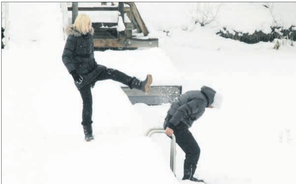
Zaledenelo Šmartinsko jezero je v nedeljo marsikoga mikalo, vendar nihče ni zbral toliko poguma, da bi se po njem brezskrbno drsal. Nekateri so previdno preizkušali vzdržljivost in debelino ledu, a niso želeli tvegati pristanka v jezeru.

Tudi na Škalskem jezeru drsate na lastno odgovornost, v velenjski občinski upravi pa želijo vseeno prispevati k varnosti drsalcev, zato so se odločili za dnevne meritve debeline ledu na očiščenem delu jezera. Minuli teden so meritve pokazale 13 centimetrov debel led, ob jezeru pa so postavili tablo, na kateri je debelina ledu tudi zapisana. Prav tako bodo podatek vsak dan objavljali na občinski spletni strani. Konec minulega tedna so ob jezeru postavili tudi razsvetljavo in tako omogočili drsanje tudi v večernih urah. Vseeno v občinski upravi pri drsanju opozarjajo na nujno potrebno previdnost. US