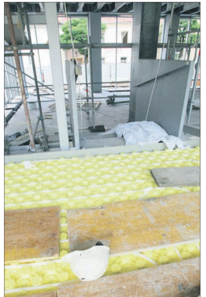
Takole je obležalo truplo 46-letnega hrvaškega delavca na Muzejskem trgu. Do konca februarja naj bi bilo znano, ali bo kdo za to odgovarjal.

V Linhartovi ulici je pod 800-kilogramskim železnim stebrom umrl 51-letni delavec, njegov 35-letni kolega pa je zaradi poškodb umrl nekaj minut kasneje v bolnišnici. Oba sta bila iz Bosne in Hercegovine, v Celju na začasnem delu. Na Muzejskem trgu pa je umrl 46-letni državljani Hrvaške. Padel je z višine desetih metrov med montažo prečnika za dvigalo. Nesreča se menda ne bi zgodila, če bi na delovišču upoštevali varnostna pravila. Medtem ko so se decembra kriminalisti oklepali stavka, da »v interesu preiskave ne morejo povedati ničesar«, pa so bili bolj zgovorni inšpektorji, ki so na obeh deloviščih ugotovili nepravilnosti, povezane predvsem z varnostjo in v zvezi s posredovanjem delavcev (tržnica). Na celjsko policijo smo se z vprašanjem, ali morda zdaj lahko