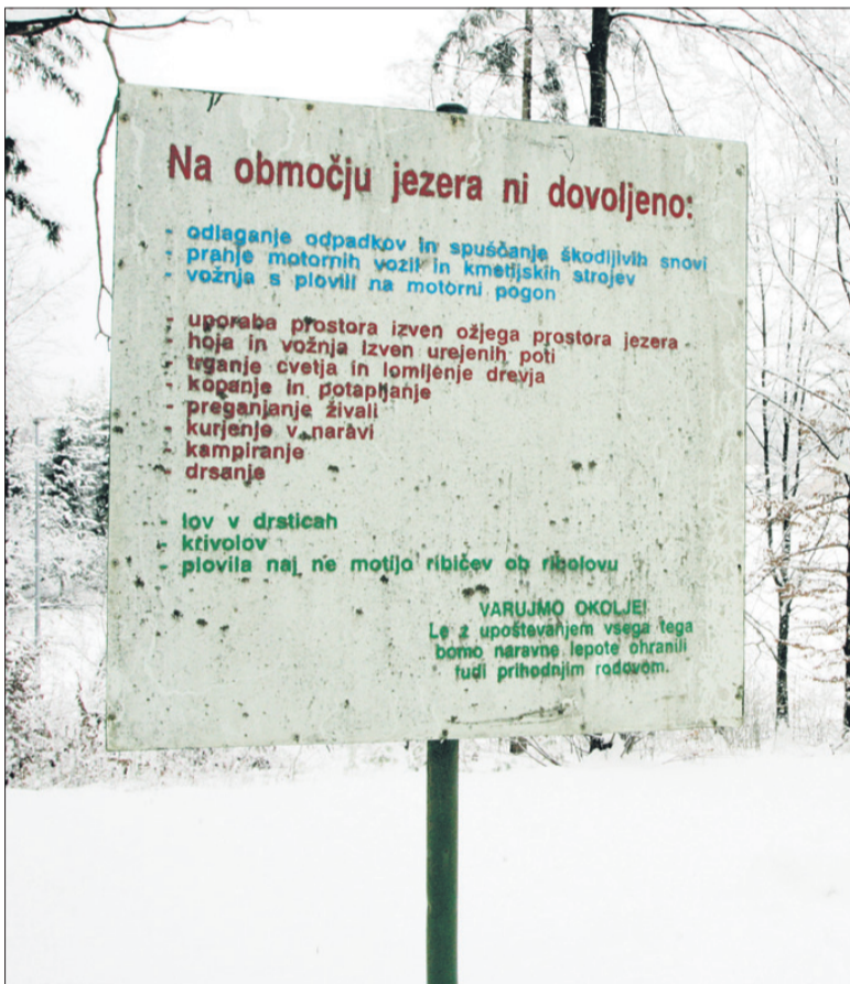
Tabla ob jezeru opozarja, česa vse na tem območju ne smete početi.