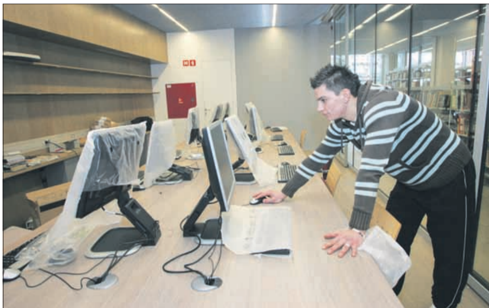
Sodobna čitalnica z računalniki. Knjižnico je od 18. januarja do konca meseca obiskalo 9.710 ljudi, ki so si v tem času izposodili več kot 48 tisoč knjig in vrnili skoraj 31.500 knjig in drugega gradiva.

Knjižnica ima v poprečju več kot 1.500 obiskov dnevno in v letu dni opravi dober milijon in sto tisoč izposoj oziroma vračil, letno pa naštejejo 330 tisoč obiskovalcev.