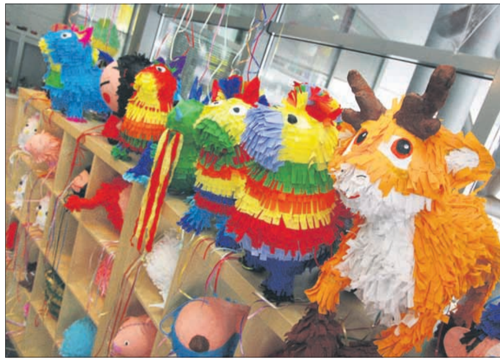
Tudi to je Tehnopolis.