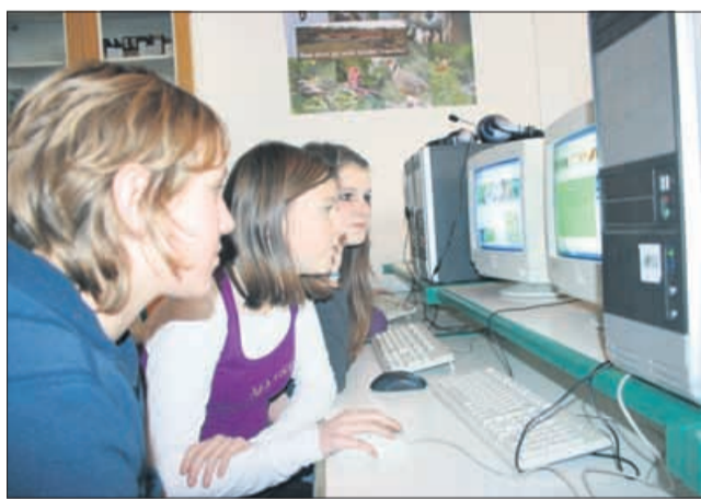
Tekmovanje preko svetovnega spleta. S predstavitve ekokviza, ki je bila na državnih ravni v zmagovitem Rogatcu.

V Osnovni šoli Rogatec, od koder so lanski državni prvaki, so pripravili predstavitev ekokviza na državnih ravni.