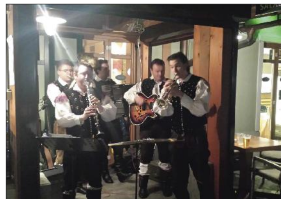
Biatlonska zabava v Lovcu.

V času svetovnega pokala v biatlonu na Pokljuki je Pub Lovc gostil navdušence nad tem zanimivim športom. Šestega marca so posebej v njihovo čast priredili »biatlonski« večer, na katerem so navijače in udeležence svetovnega pokala zabavali Bohinjski muzikantje. Dogodek se je začel na terasi, ko je zunaj postalo hladno, pa so se gostje preselili v Pub, kjer so ob žlahtni kapljici, odlični glasbi in zabavnih družabnih igrah proslavljali še naprej.