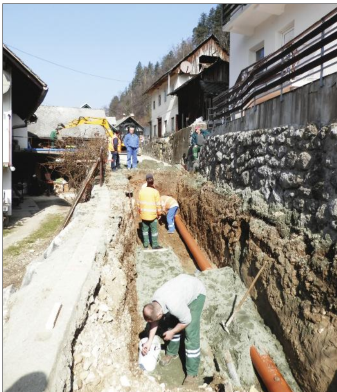
Dela na Mlinem

Občina Bled je septembra lani začela z urejanjem starega jedra vasi Mlino. Dela so vredna preko milijona evrov in so sofinancirana s strani Evropskega sklada za regionalni razvoj, ki bo prispeval nekaj manj kot sedemsto tisoč evrov. Na območju zgornje Prežihove ceste so v cesto že položili celotno komunalno infrastrukturo, izvajalec gradbenih del je pričel z ureditvijo vaškega jedra, s polaganjem granitnih kock. V takem obsegu so dela zaključena tudi na spodnji Prežihovi ulici. Na območju Mlinske ceste trenutno vgrajujejo komunalno infrastrukturo, ta dela bodo predvidoma zaključena v drugi polovici aprila. Takoj po vgraditvi komunalne infrastrukture bo izvajalec del na območju Mlinske ceste pričel z ureditvijo ceste oz. s tlakovanjem vaškega jedra.