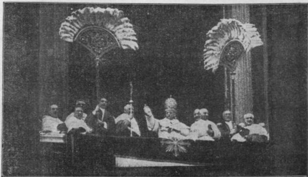
Prvi blagoslov sv. očeta — iz lože cerkve sv. Petra.

Kaj pravite, ali bi bilo toliko nezadovolj-