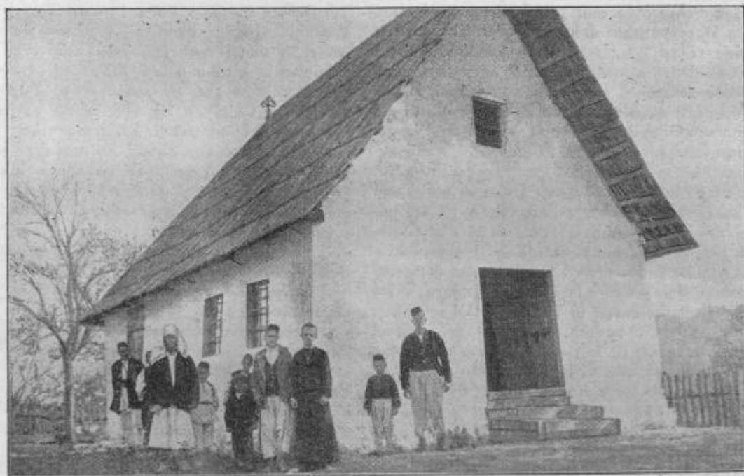
Hlev namesto cerkve, župna cerkev sv. Ane v Žabljaku v Bosni.

Izšel bo zopet »Marijin misijonski koledar«. Bodite nanj pripravljeni in ko izide, sprejmite ga dobrohotno! Obsegal bo pregled vseh slovenskih Marijinih družb.