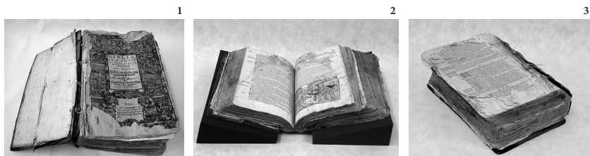
Slike 1, 2 in 3: Stanje Biblije pred konservatorsko-restavratorskim posegom

Knjižni blok obravnavane knjige, velikosti 330 × 210 mm in debeline 98–110 mm, je vseboval 674 listov, združenih v 114 leg (od tega je ena lega kvaternij, 24 vse ostale so terniji, 25 oziroma nepopolni terniji.