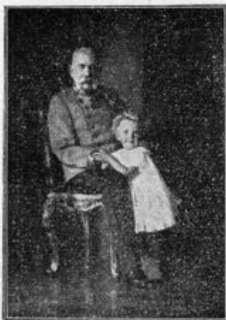
Naš apoštolski kral z detetom trononaslednikovim.