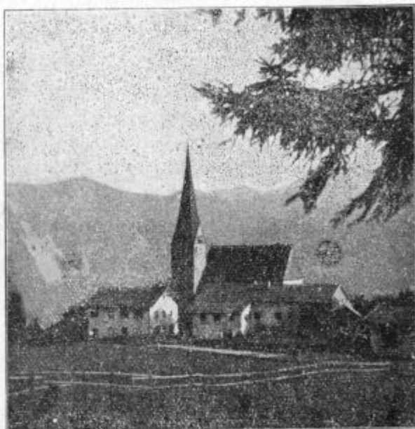
Eben na Tirolskom.

Brez računa se najde na lepom gornatom, čisto katoličanskem Tirolskom takših lepi farnih cerkvic, štere do se pa mogle porušiti v toj groznoj bojni, če sovražni talijan vderè prek mej. Prosimo Srce Ježušovo, štero je patron Tirolskoga, naj okrepi junaške tirolce i vse naše vojake, da obranijo z močnov rokov mejè té lepe katoličanske dežele.