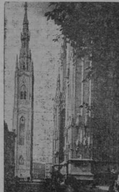
Znana cerkev v Milanu v Zgornji Italiji dobi 164 metrov visok stolp

Osmrtnice, žalne podobice, žalna pisma v Tiskarni sv. Cirila — Maribor, Ptuj