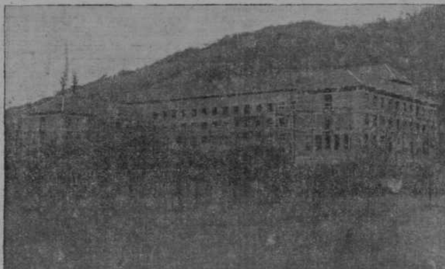
Novo mariborsko bogoslovje pod Kalvarijo je bilo dograjeno v surovem stanju 25. oktobra. Ta dan je bil čisto na tihem in v ožjem krogu »likof«, o katerem smo že poročali v zadnji številki.