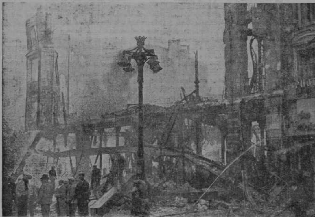
Po strašnem požaru v francoskem pristanišču Marseille, o katerem smo poročali zadnjič, znaša število mrtvih 70, ranjenih pa je bilo nekaj sto,