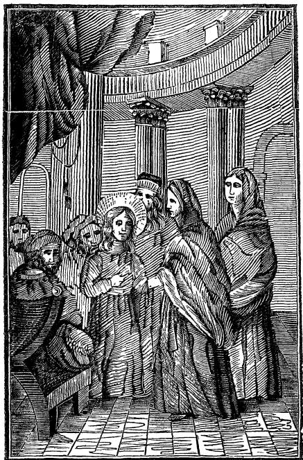
Dete Jezus v tempelnu.